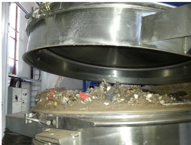
Kuva 6. Syöte pakkautuneena täriseulalle

Uudelleenseulonnassa täriseulaan asetettiin vain yksi seula verkko kerrallaan, jotta erottelu olisi yksinkertaisempaa. Seulonta aloitettiin yli 10 millimetrin jakeesta, joka seuloutui suhteellisen helposti ensimmäiseen seulontakertaan nähden. Edelleen seulatäryä ja seula verkkoa jouduttiin puhdistamaan manuaalisesti, mutta kaiken kaikkiaan materiaali kulkeutui nopeammin seulan läpi. Suurin vaikuttava tekijä tähän on luultavasti materiaalin alhaisempi kosteuspitoisuus ja vähäisempi hienoainespitoisuus ensimmäiseen seulontakertaan verrattuna. Aikaeroa ensimmäisen ja toisen seulonnan välillä oli noin seitsemän viikkoa, ja koska seulotut jakeet säilytettiin tuona aikana huoneenlämmössä suursäkeissä, niistä oli haihtunut kosteutta.