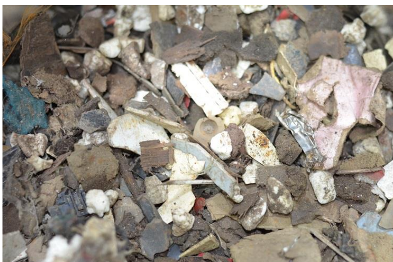
Kuva 4. Yli 10 millimetrin jae

Ensimmäinen seulonta suoritettiin Lahti Ekoparkissa pilot-mittakaavan täryseulalla (kuva 5). Täryseulaan pystyy samanaikaisesti lisäämään kaksi seulaverkkoa, tutkimusta varten seulaverkkojen koot olivat 10 ja viisi millimetriä. Koot valittiin sillä perusteella, että näin oletettiin alitteen kulkeutuvan suhteellisen vaivattomasti seulan läpi. Lopputuloksena saatiin kolmea eri jaeetta: yli 10 millimetrin, 5-10 millimetrin ja alle 5 millimetrin jakeet.