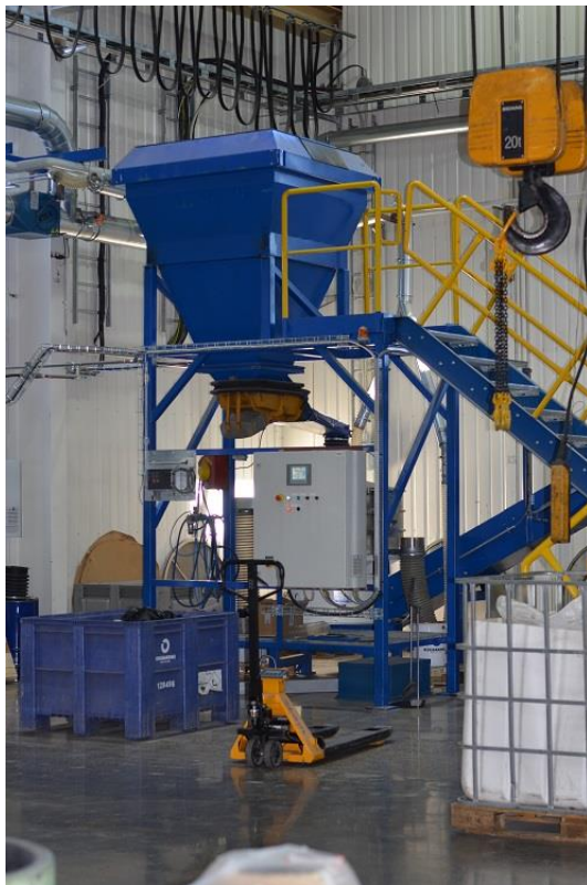
Kuva 5. Pilot-mittakaavan täryseula Lahti Ekoparkissa

Syöte laskettiin kerralla seulan syöttösuppiloon, josta sen tuli kulkeutua syöttötäryn kautta tasaisesti seulaan. Syötteen kosteuden ja hienojakoisuuden vuoksi se pakkautui syöttösuppiloon ja tukki syöttötäryn. Lisäksi syöte tukki molempia seulaverkkoja (kuva 6), eikä materiaali kulkeutunut seulaverkkojen läpi. Jopa ylimmälle seulaverkolle jäi alle viiden millimetrin ainesta materiaalin koostumuksen ja kosteuden vuoksi. Materiaali pakkautui seulaverkon sivustoille ja keskelle, joten sitä joutui manuaalisesti puhdistamaan ajon aikana. Myös syöttösuppiloa ja seulatäryä jouduttiin manuaalisesti puhdistamaan, jotta syöte saatiin kulkeutumaan seulan läpi. Saaduista jakeista oli selkeästi havaittavissa, että alle 5 mm ainesta oli kaikkien jakeiden seassa. Näin ollen toteutettiin uudelleenseulonnat yli 10 millimetrin ja 5-10 millimetrin jakeille.