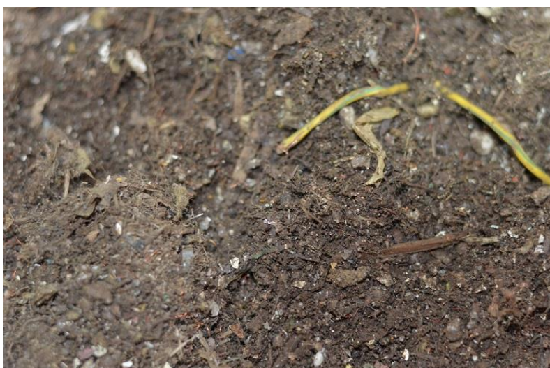
Kuva 2. Alle 5 millimetrin jae

Ennen varsinaista seulontaa suoritettiin koeseulonta 16 kilogramman näyte-erälle, jotta voitaisiin havaita mahdollisia seulonnassa syntyviä ongelmia ja saataisiin vertailupohjaa varsinaisen seulonnan tuloksille. Koeseulonnan aikana havaittiin, ettei materiaali kulkeudu vaivattomasti seulan läpi, mutta seulotut jakeet vaikuttivat lupaavilta tutkimuksen kannalta (kuvat 2-4).