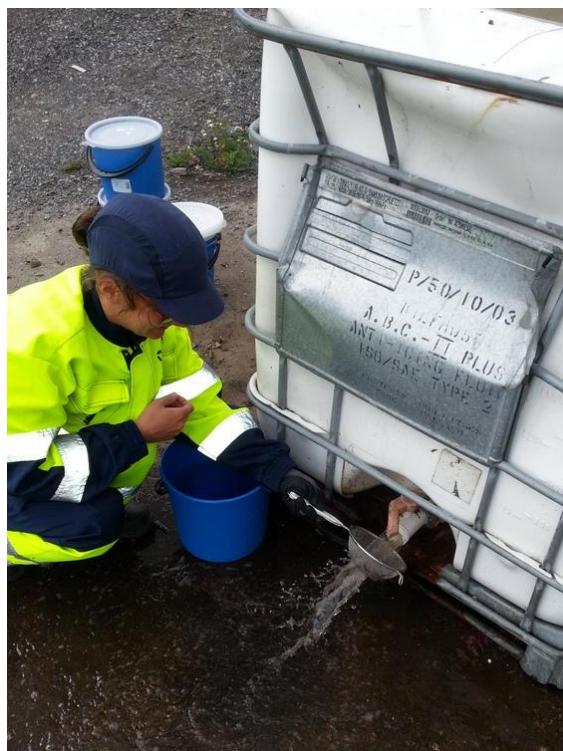
Kuva 7. Uputus-kellutuskokeen loppusiivilöinti

Koko alitemäärän lisäämisen jälkeen sisältöä sekoitettiin voimakkaasti pohjaa myöten, jotta viimeisetkin kelluvat partikkelit nousisivat pintaan. Tämän jälkeen seoksen annettiin asettua noin kymmenen minuuttia, pinnalta kerättiin kelluva materiaali pois ja vesi laskettiin ulos säiliöstä. Varmistukseksi kaiken materiaalin talteenottaminen, hanan alla pidettiin siivilää (silmäkoko noin yksi millimetriä), joka tarvittaessa tyhjennettiin ämpäriin. Silmäääräisesti tarkasteltuna hanasta tuleva vesi oli melko kirkasta, mutta oletettavasti pienijakoisin materiaali kulkeutui siivilän silmikoiden läpi. Säiliön pohjalle kertynyt uponnut materiaali kerättiin lapion avulla ämpäreihin. Lopuksi säiliö huuhdottiin ja loput materiaalit kerättiin hanasta siivilän avulla (kuva 7).