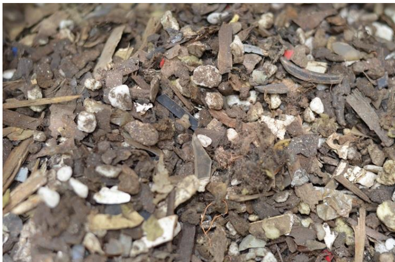
Kuva 3. 5-10 millimetrin jae