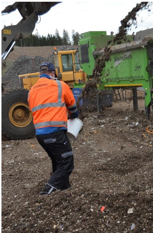
Kuva 1. Osanäytteenottoa tähtiseulalta

Koeseuluntoja varten kerätty näyte koostui 100:sta kahdeksan litran osanäytteestä (kuva 1), joka koottiin noin 1000 tonnista murskan kevytjaetta. Kokoomanäyte kerättiin suursäkkiin. Alkuperäisessä näytteenottosuunnitelmassa oli tarkoitus kerätä osanäyte noin 40 minuutin välein, mutta noin seitsemän osanäytteen jälkeen ilmeni, että näytteet tulee kerätä tiheämpään tahtiin, jotta näytteitä saadaan toivottu määrä. Näytteenottoahti tihennettiin noin 10–15 minuuttiin. Kokonaisuudessaan näytteitä otettiin seitsemän päivän aikana.