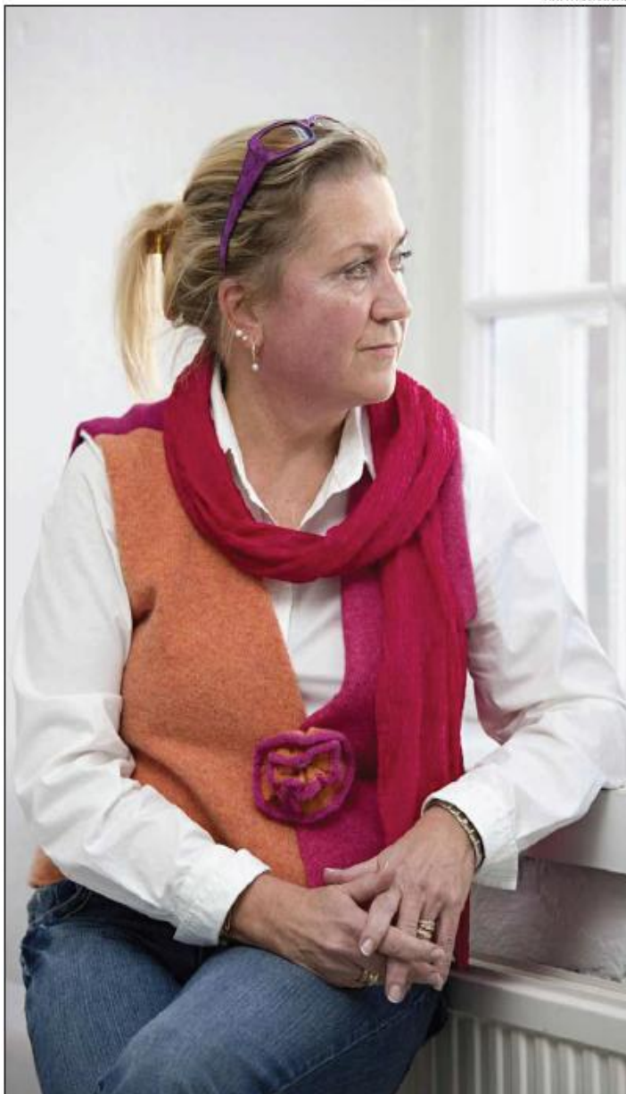
KIRJOITTI SURUKIRJAN Anja Snellmanin sisko menehtyi vuosi sitten.

Lokakuussa ilmestyvä Maru on Anja Snellmanin uusi romaani, joka sal alkunsa vuosi sitten kirjailijan siskon kuolemasta.