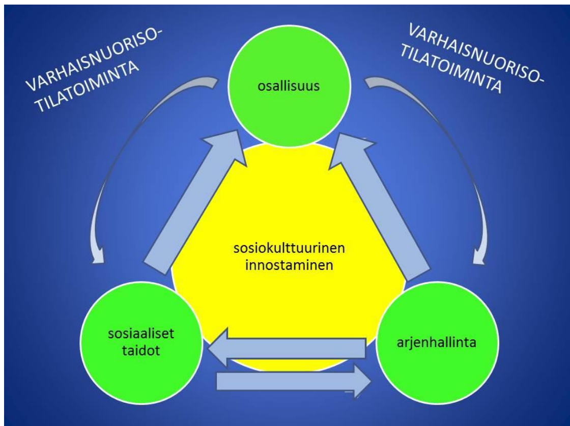
KUVA 1. Tilatoiminnan pyhä kolminaisuus

Toiminnan alussa osallistujien tarpeet asettivat ohjauksen painopisteen sosiaalisten taitojen tukemiselle. Arjenhallinnallisia teemoja pääsimme käsittelemään osallistujien sosiaalisen pääoman lisääntyttyä. Vasta sosiaalisten ja arjenhallinnallisten taitojen edistyminen loi valmiuksia osallisuuden syntymiselle. Myös Gretschemin (2007a, 246) mukaan yhteisöön kuulumisen tunne voi syntyä, kun kyky elämänhallintaan ja elämänlaadun parantamiseen lisääntyy sosiaalisten tietojen ja taitojen karttumisen myötä. Havaitimme toiminnassamme lisäksi sen, että osallisuus edisti ja syvensi edelleen sosiaalisia ja arjenhallinnallisia taitoja. Kaikki nämä osa-alueet tuntuivat olevan erityisen sidoksissa toisiinsa, sillä ne sisälsivät paljon samoja elementtejä ja tarvitsivat toteutuakseen toinen toisiaan. Tästä syystä aloimmekin leikkillisesti kutsua näitä osa-alueita ”tilatoiminnan pyhäksi kolminaisuudeksi”, jonka edistämiseen sosiokulttuurinen innostaminen soveltui menetelmänä erinomaisesti. Teimme tästä oivalluksesta sitä havainnollistavan kaavion (KUVA 1).