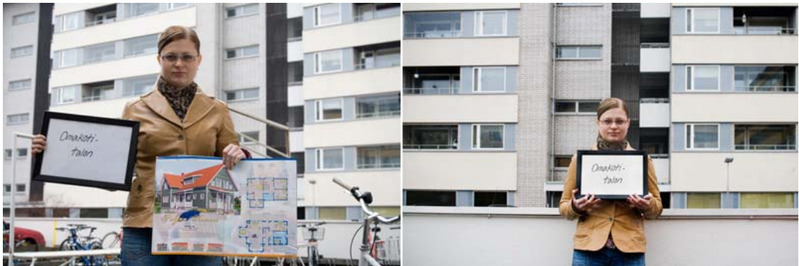
Kuva 8. Alkuperäisten suunnitelmista poiketen jätimme esitteen pois, minkä seurauksena kuva yksinkertaistui.

Haave tuli hyvin esille yksinkertaistamalla kuvaa sen sijaan, että kuvassa olisi ollut sekä konkreettisesti kuva haaveesta että nykyinen tilanne. Teksti ”Omakotitalon” antoi tarpeeksi ristiriitaa taustalla olevien kerrotalojen kanssa.