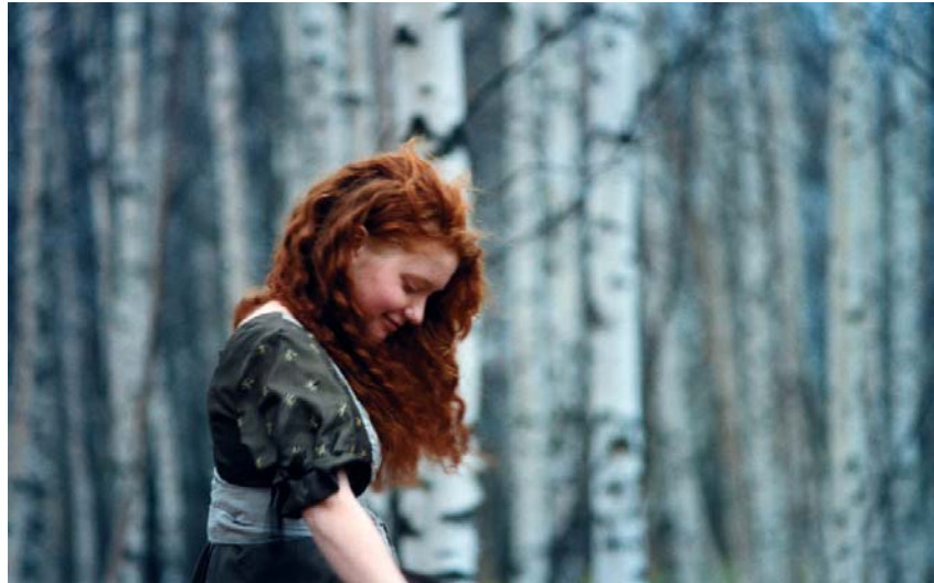
Kuva 4. Maailman ihanin tyttö -kuvat on otettu pitkään suunnitelluilla kuvausretkillä.

(Savolainen M. 2006). Haluaisin-projektin kuvat ovat syntyneet hyvin nopeatempoisesti ilman pitkiä suunnitelmia. Kuvaaja ja malli ovat olleet ympäristön ja sään armoilla sovittuna ajankohtana sen sijaan, että oltaisiin Savolaisen tavoin odotettu esimerkiksi tiettyä vuoden aikaa.