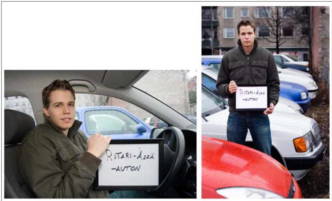
Kuva 7: Ritari Ässä -auton -kuvaustilanne muistutti lehtikuvausta. Oikeanpuoleinen vaihtoehto valittiin lopulliseksi kuvaksi.

Kaikki kuvauspaikat sijaitsivat Porissa. Käytimme hyväksi mallien koteja, kun kuviin haluttiin kodin tuomaa turvallisuuden tunnetta sekä myös arkea. Urheilullisissa kuvissa käytettiin lajin harrastuspaikkaa hyväksi. Jotkut kuvat oli helpointa kuvata studiossa. Tällöin kuvausympäristössä oli hyvin hallittu valo ja käyttötarkoitukseen sopiva tila. Muita kuvauspaikkoja olivat mm. liiketila, Porin Eetunaukio, kerrostalon sisäpiha, tie ja rakennuksien edustat.