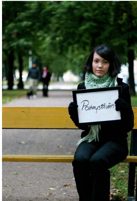
Kuva 12. Kuvan taustalla kävelevää pariskuntaa pyydettiin kävelemään ohi toisen kerran.