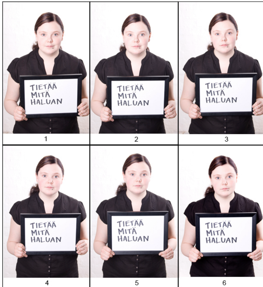
Kuva 10. Kuvan luonne muuttui mallin ilmeiden vaihtuessa vähäisestikin.

Hyvin pienetkin tekijät vaikuttivat lopullisen kuvan valintaan. Pienet ilmeiden muutokset kuvissa olivat suuria tekijöitä kuvan valinnassa. Hyvä esimerkki ilmeiden vaihtelevuudesta näkyy teoksessa ”Tietää mitä haluaisin”, jossa ilmeikäs kuuden kuvan sarja on otettu minuutin aikana (Kuva 10).