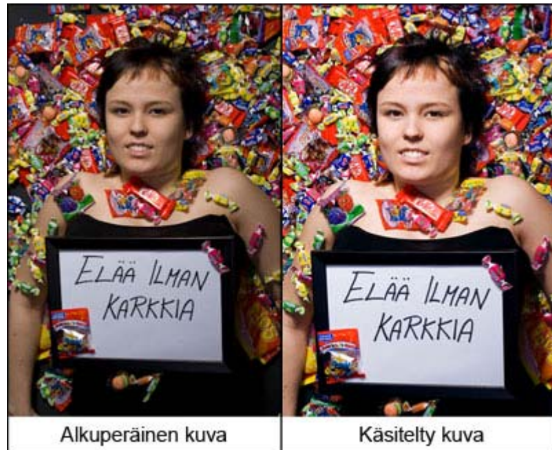
Kuva 9. Kuvaa on käsitelty rajauksen sekä värien ja kirkkauden säädön lisäksi kopioimalla karkkeja tyhjiin kohtiin.

enemmän kopioiden karkkeja puuttuviin kohtiin. Mielestäni se ei ole liikaa kuvamanipulointia, koska nyt katsojan huomio kiinnittyy itse malliin, eikä taustalla näkyviin tyhjiin kohtiin (Kuva 9).