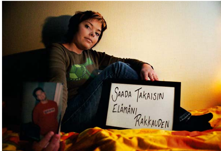
Kuva 13. Mallin ojentamaa valokuva syventäisi kuvan merkitystä näyttelyssä.

aineettomia tai niihin on muuten hankala hankkia rinnalle aineistoa, joten säilytän jatkossakin vain mallien kirjoittamat toiveet.