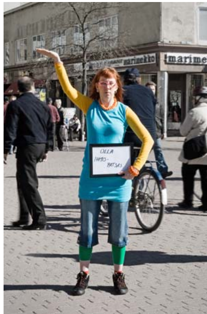
Kuva 1. Joillakin malleilla oli hyvin persoonallisia toiveita, kuten ”Olla ihmispatsas”.

Näyttelykuvissa olin käyttänyt sekä tuttuja että tuntemattomia malleja, joille olin tehnyt projektista pienen esitteen (Liite 1). Opinnäytetyötä varten haastattelin vuonna 2005 kuvaamiani Haluaisin-malleja. Kysyin heiltä, miltä heistä otetut valokuvat tuntuvat nyt, kun aikaa on kulunut. Mitä haaveille on tapahtunut – ovatko ne toteutuneet vai muuttuneet? Kaduttaako osallistuminen projektiin näin jälkikäteen vai lähtisivätkö he mukaan uudelleen? Käsittelen vastauksia luvussa 4.1 Vuoden 2005 projektin tulokset.