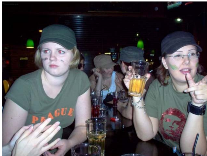
Kuva 3. Esimerkki IRC-galleriassa olevasta 80-luvulla syntyneen nuoren kuvasta.

Painoin IRC-gallerian Satunnainen-linkkiä 50 kertaa tutkien satunnaisia kuvia 80-luvulla syntyneistä nuorista. Tarkkailin millaisia kuvia nuoret julkaisevat itsestään kaikkien nähtäville. Tyypillistä kuville oli, että ne olivat itseotettuja (peilin kautta tai käden mitan verran edestä), kuvattu juhlissa tai baarissa, kuvissa oli alkoholia, ne olivat laadultaan huonoja pikselien erottuessa selvästi, henkilö oli matkalla, kuvaa oli käsitelty ylipimeäksi tai värejä oli muunneltu huomattavasti tai kuvassa oli mukana useampia henkilöitä. Vain muutama kuva oli minun mielestäni perusmuotokuva, jossa henkilö poseeraa kameralle ilman ylimääräisiä häiriötekijöitä ympärillä. Haluavatko nuoret ilmaista ns. biletyskuvilla, että ne ovat sosiaalisia ja hyviä tyyppisiä, joilla on kavereita?