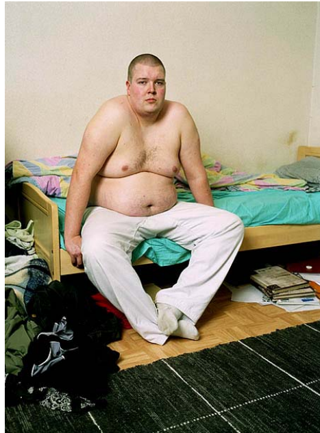
Kuva 5. Big Boyz -sarjassa mallit katsoivat suoraan kameraan.

sijaan minuun on otettu yhteyttä ja kyselty, että kaipaanko malleja. Erikssonin piti omaa projektia varten ottaa yhteyttä n. sataan henkilöön, joista vain joka kymmenes suostui kuvattavaksi. (Eriksson 2006, 75). Big Boyz -sarjassa kaikki mallit katsovat suoraan kameraan, joka tuo kuvaan läheisyyttä ja mielestäni myös rohkeutta (Kuva 5). He hyväksyvät oman ulkonäkönsä ja uskaltavat esiintyä valokuvassa.