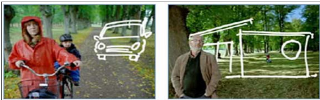
Kuva 6. Pysäytyskuvia Nordean tv-mainoksista.

Kaupallisesta näkökulmasta Haluaisin-kuvia voisi verrata Nordean ”Teemme sen mahdolliseksi” -kampanjan tv-mainoksiin (Kuva 6), joissa ihmiset pitelevät käsissään isoa lasia, johon on piirretty heidän haaveensa – naiselle isompi maha lasta toivoessa, metsään uusi talo, palmuja lomamatkaa haaveillen. Nordea voisi teoriassa lainoillaan mahdollistaa joitakin Haluaisin-toiveitakin, mutta kaikkia haaveita ei rahalla saa.