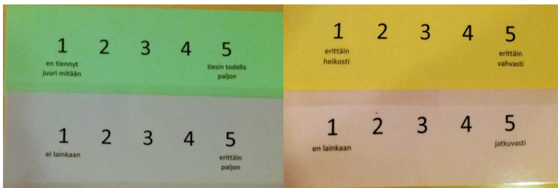
Kuva 1. Järjestysasteikot

käytettiin neljää eri väriä: vihreää, vaaleanpunaista, violettiä sekä keltaista eri teemojen mukaisesti. Asteikkoliuskosten määräksi tuli kokonaisuudessaan kymmenen kappaletta, mutta asteikkoliuskot käytettiin osittain kahteen kertaan, sillä muutosta tarkastelevissa, peräkkäisissä kysymyksissä käytettiin useimmiten yhtä samaa asteikkoliuskaa.