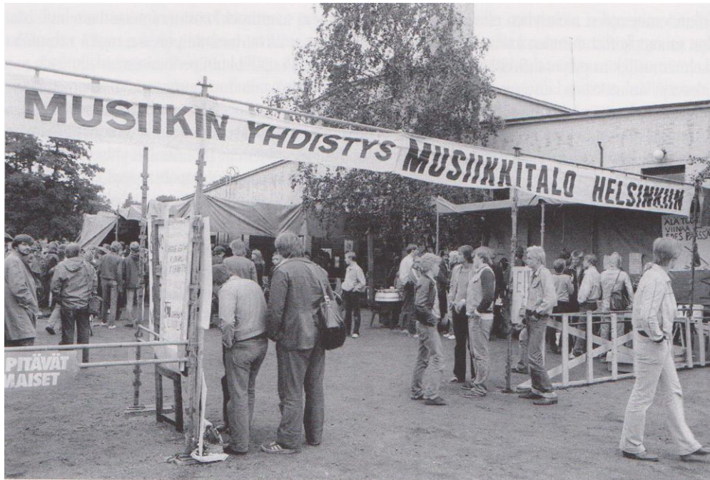
KUVA 3. Elmun väkeä Helsingin Lepakon pihalla elokuussa 1979 (Aroheimo-Marvia ym. 2003, 595)