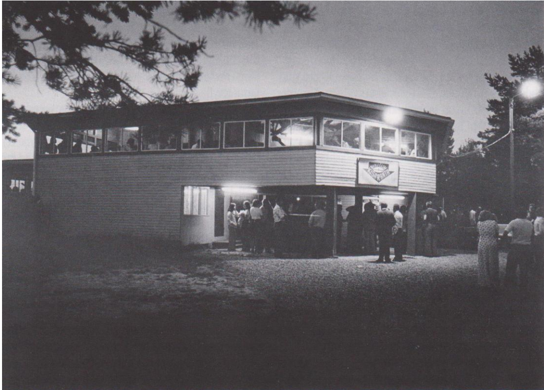
KUVA 2. Perinteinen lavatanssipaiikka Etelä-Pohjanmaalla (Aroheimo-Marvia ym. 2003, 480)

Suomessa 1960-luvulla elävää rock-musiikkia pystyi kuulemaan lähinnä koulujen nuorisotilaisuuksissa tai lavatansseissa (kuva 2), joihin oli hankittu sekä tanssiorkesteri että rockbändi (Nevalainen 2005, 10). Pääkaupunkiseudulla oli lisäksi lukuisten eri kaupunginosien nuorisokerhoja. Keikkatarjonta oli pääkaupunkiseudulla siis huomattavasti paremmat kuin muualla Suomessa, koska koulujakin oli siellä paljon enemmän. (Bruun ym. 1998, 85.)