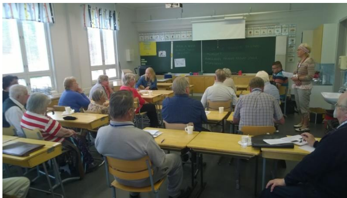
Kuva 1. Temmeksen ideariihitapahtuma

Tapahtumia varten oli kirjattu kolme erillistä teemaa, joita käytettiin myös tapahtumien mainostamisessa. Teemat olivat: mitä ovat terveyttä edistävät palvelut, minkälaiset palvelut toisivat sinulle hyvinvointia sekä miten ja missä palvelut tulisi järjestää. Näiden teemojen pohjalta keskustelua johti vanhusneuvoston jäsen ja me toimimme sihteereinä.