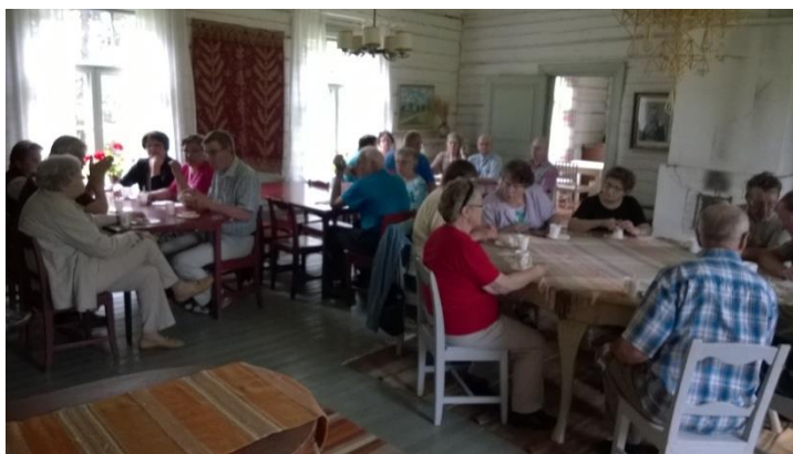
Kuva 2. Tyrnävän ideariihitapahtuma

keskustelu oli vilkasta. Puheenjohtaja joutui välillä ohjaamaan keskustelua ennalta sovittuihin teemoihin, koska keskustelu muuttui palautteen antamiseksi vanhuspalveluista.