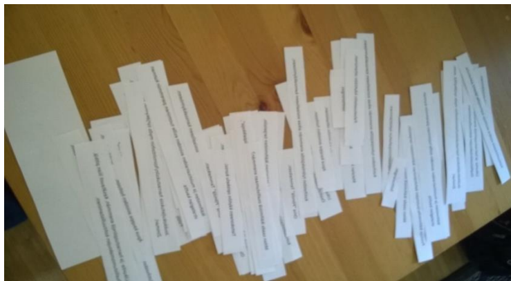
Kuva 3. Idealaput

Tämän jälkeen mietimme mikä olisi hyvä menetelmä esittää vanhusneuvostolle ideariihistä saadut kehittämisideat. Päädyimme kirjoittamaan kehittämisideat paperille, jonka jälkeen ne leikeltiin idealapuiksi. Kaikki tapahtumista saadut kehittämisideat olivat yksittäisinä idealappuina, lisäksi mukaan laitettiin vielä yksi tyhjä lappu osallistujan mahdollista omaa ideaa varten (Kuva 3).