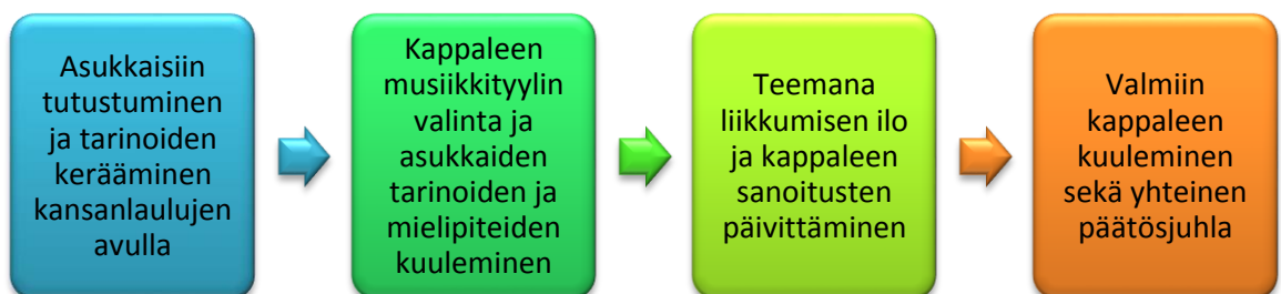
Kuva 1. Tuokioiden prosessi

Oman musiikkikappaleen ideoinnin sekä sävellys- ja sanoitustyön lisäksi aloitimme ja päätimme jokaisen tuokion tutuilla kansanlauluilla. Kansanlaulujen avulla pääsimme ikääntyneiden kanssa hyvään ja rentoon tunnelmaan, jonka jälkeen oli helpompaa ideoida yhdessä omaa musiikkikappaletta. Vanhat kansanlaulut myös herättivät ikääntyneissä tunteita ja muistoja, joiden jakamisen myötä yhteisen kappaleen luomistyökin helpottui huomattavasti.