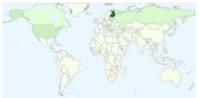
Taulukko 2. Sivun katselut maiden mukaan maaliskuussa 2015.