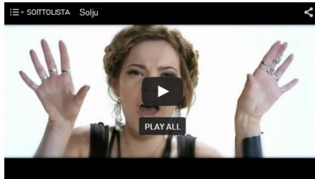
Solju - Hold Your Colours