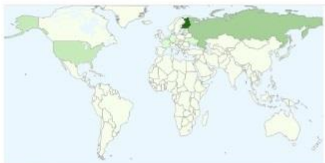
Taulukko 11. Blogin katselut maiden mukaan marraskuun 2015 alussa.

Blogin aloitustilanne aineiston kannalta oli hyvä, sillä Sommelon arkistoista löytyi julisteita, käsiohjelmia sekä lehtileikkeitä aikaisempien kesien Musiikkijuhla Sommelosta. Lehtileikkeistä löytyi ennakojuuttuja, joissa käsiteltiin niin festivaalin esiintyjä, tilaisuuksia kuin teemoja festivaaliin liittyen. Olen ollut itsekin päivittämässä lehtileikearkistoa useampana kesänä.