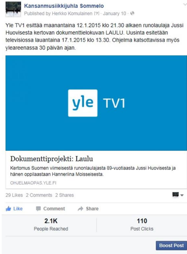
Kuva 2. Dokumenttiprojekti: Laulu

dokumenttielokuva Laulu . Yle TV1 esitti dokumentin ensimmäisen kerran tammikuun 12. päivä ja uusintana 17. päivä tammikuuta 2015. Kirjoitin julkaisun Sommelon facebookkiin, johon laitoin myös linkin Yle Areenaan (kuva 2).