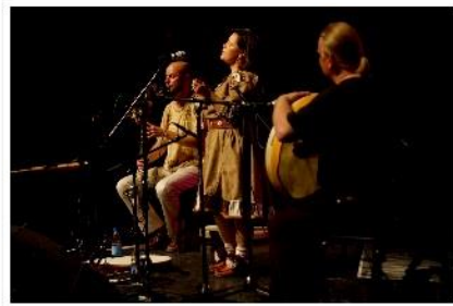
Kuva 7. Blogijulkaisu Shavasta ja Soljusta.