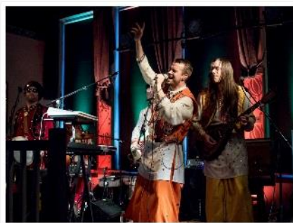
Kuva 8. Blogijulkaisu Solju.

Jonkin ajan kuluttua tekstien julkaisusta sain yhteydenoton keväällä 2015 Uuden Musiikin Kilpailussa mukana olleen Norlan El Misionarion konserttivälittäjä. Hän oli päätenyt lukemaan Soljuun ja Shavaan liittyvät julkaisut blogista ja otti yhteyttä julkaisujen innoittamana.