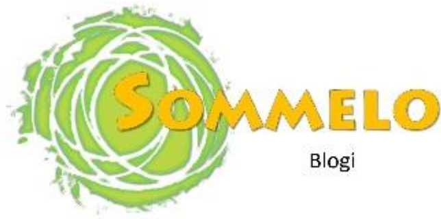
Kuva 11. Blogibanneri Sommelon etusivun vasemmassa laidassa.