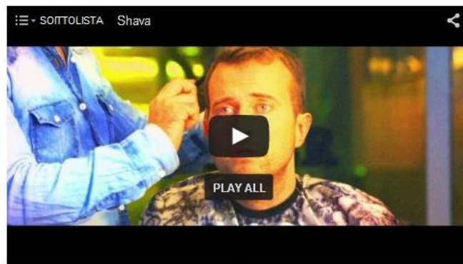
Shava - Ostarilla