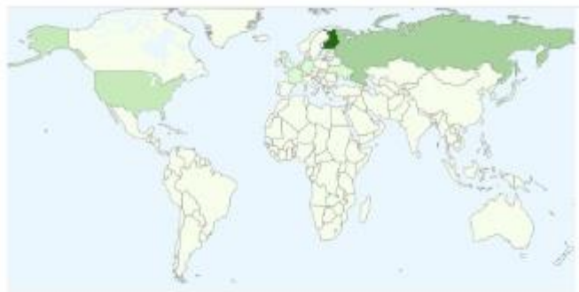
Taulukko 5. Sivun katselut maiden mukaan syyskuu 2015.