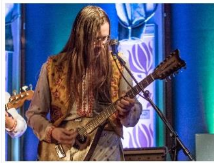
Shava, Sommelo 2014