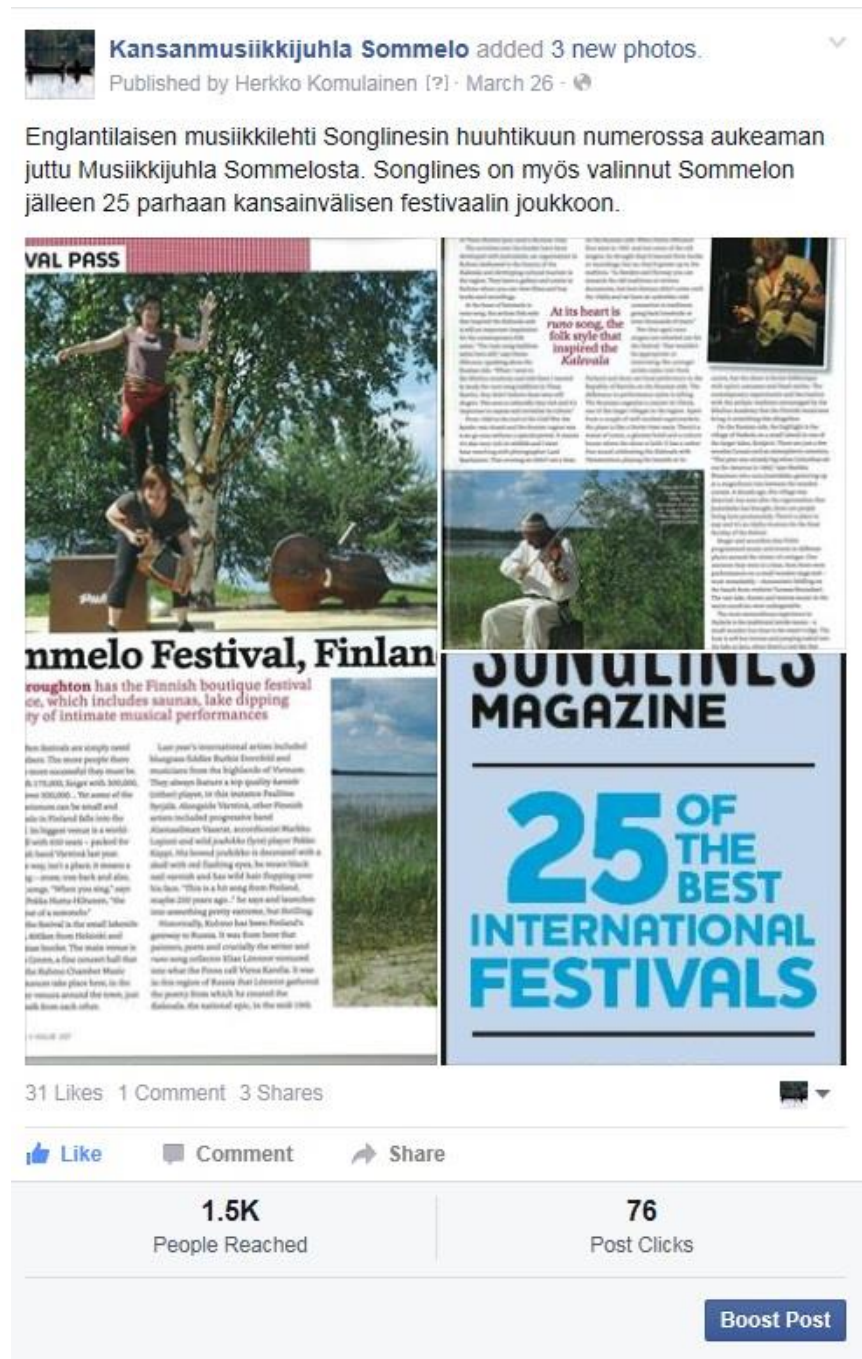
Kuva 1. Sommelo 25 parhaan kansainvälisen festivaalin joukossa.

peräkkäin. Sommelen facebookissa julkaistu päivitys, joka sisältää lehden kirjoittaman englanninkielisen jutun tapahtumaan liittyen, on tavoittanut vähintään 1 500 ihmistä (kuva 1).