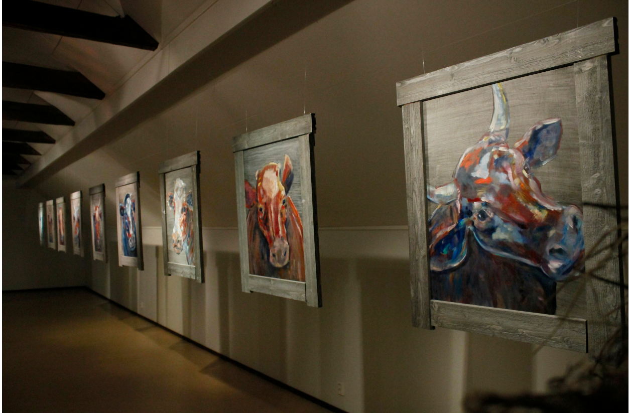
Kuva 13. Lehmätaulut kehyksineen. Taidekeskus Haihara

Asetin tavoitteekseni tuoda teoksellani esille sitä aikaa, jolloinka vanhempani ottivat tilan nimiinsä. Tähän päädyin paljolti myös sen takia, että perhealbumista löydetty valokuva oli otettu vuodelta 1981, milloin vanhempani yhdessä sukulaistemme kanssa olivat palaneet heinäseivästyksestä. Sain ajatuksen pystyttää tilaan heinäseipäät ja asetella myös maitotonkkia kuvaamaan tuota ajankautta.