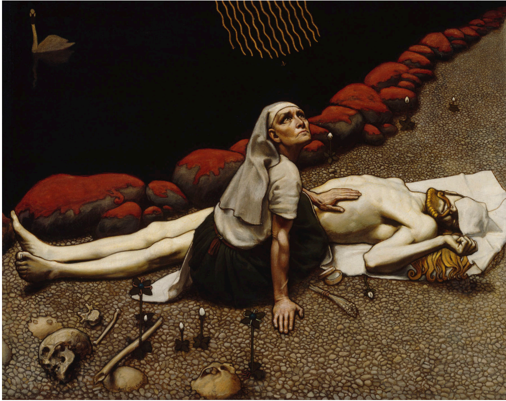
Kuva 2. Akseli Gallen-Kallela, Lemminkäisen äiti (1897)

Akseli Gallen-Kallela on yksi Suomen merkittävämpiä kuvataiteilijoita, joka tunnetaan paljon Kalevala-aiheisista maalauksista. Lähes kaikki kansalliset taiteilijamestarimme ovat jossain vaiheessa tuotannonvaiheessaan ottaneet kuvattavakseen eläimiä tai liittäneet niitä täydentääkseen kuvien sanomaa. Esimerkiksi Akseli Gallen Kallelan eräässä tunnetuimmassa maalauksessa Lemminkäisen äiti (1897) on täynnä kuoleman ja epätoivon merkkejä, jossa Tuonelan joutsenella on vahva symbolinen merkitys kuvan tarinassa. Joutsen esitetään Kalevalan taruissa myös pyhänä eläimenä, jonka tappaminen tiesi tekijälleen kuolemaa. Joutsenen kauneus on usein liitetty pyhyyteen, koskemattomuuteen, jota esimerkiksi Eino Leino on käsitellyt runoudessaan, jossa joutsenen vahvaa symbolismia on tuotu esille (Hatakka 2008).