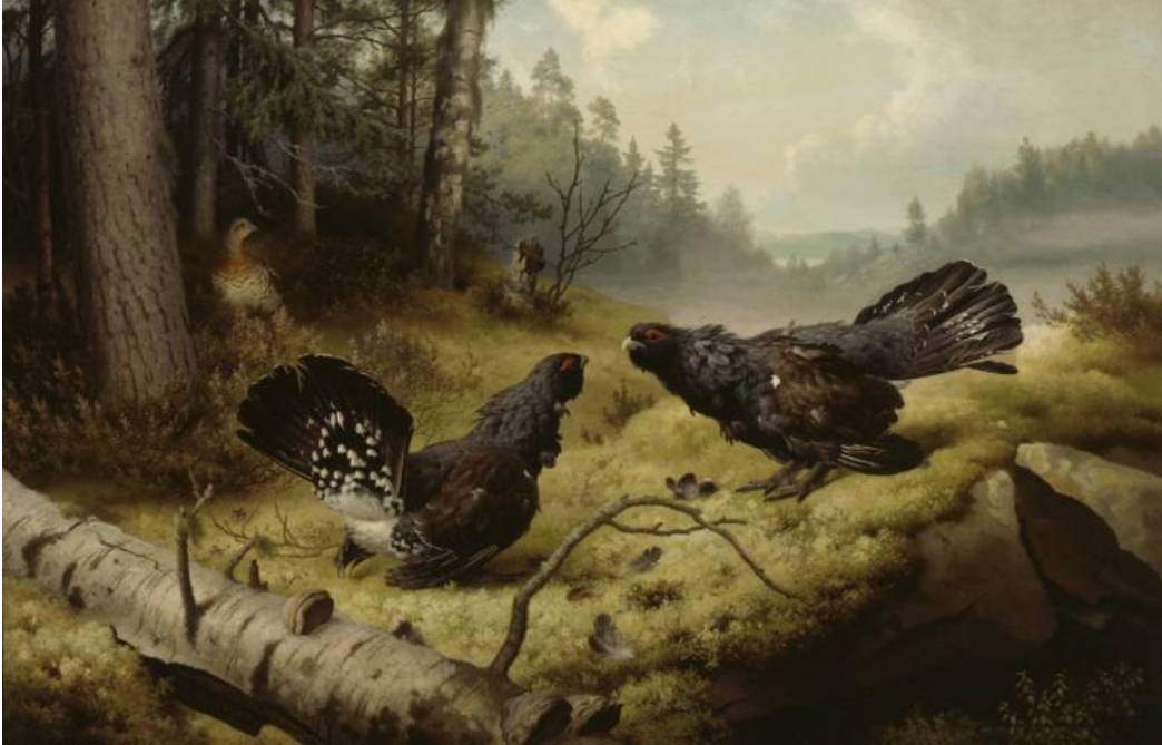
Kuva 3. Ferdinand von Wright: Taistelevat metsot , (1886)

Taistelevat metsot on yksi merkittävämpiä kansallisromantiikkaa kuvaavia maalauksia Suomen historiassa. Ferdinand von Wrightin tunnetuin maalaus valmistui vuonna 1886 taiteilijan ollessa yli 60-vuotias ja se edustaa hänen myöhäistuotantoaan. Taistelevien metsojen merkitys Suomen taiteen historialle on ollut suuri, mutta vielä suurempi merkitys sillä on ollut koko Suomen kansalle. Teoksesta ilmenevä luonnontaistelun kuvaus yhdistettiin Suomen kansan kohtaloon, jota vaivasi epävarmuus vuosisadan vaihteen poliittisten myllerrysten johdosta. Teoksen aihe ja luonnonkuvauksen tapa koskettivat suomalaisia ja lukuisten jäljennösten, versioiden ja painokuvien myötä siitä on muodostunut suomalaisen taiteen tärkeä kansallinen symboli. Teoksen vertauskuvalliset merkitykset ovat rakentaneet sille oman merkittävän jalustansa, niin sodan kuin rauhan aikana. Symboliikka on voimakas maalauksessa ja sen dramatiikkaa lisää luonnon villiys. Toisin kuin lehmät, metsot on kuvattu niiden omassa elinympäristössä keskellä, joka antaa maalaukselle voimaa ja poistaa ihmisten niille itse asettamat olosuhteet sekä vallan.