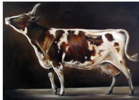
Kuva 6. Päivi Latvala: Yninä (2005)