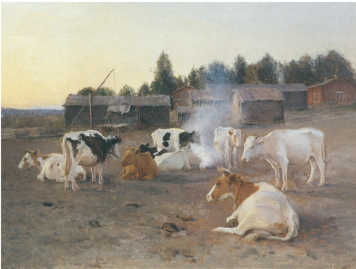
Kuva 1. Eero Järnefelt, Lehmisavu (1891)

Olen ottanut käsiteltäväkseni Suomalaista maalaustaidetta ja tekijöitä, joilla eläimet ovat suuressa roolissa heidän tuotannossaan. Tässä kohtaa tulen tekemään jonkin verran pohdintoja ja vertauksia omaan lopputyöhöni liittyen siitä kuinka itse näen käsittelemissäni teoksissa eläinten arvostamisen ja henkilöitymisen tulevan ilmi. Olen valikoinut mukaan sellaisia teoksia, joista voin tehdä päätelmiä tutkimustekstissäni esittämiäni asioita kohtaa ja vastaila omin sanoin kuinka eri tutkimani symboliset arvot tulevat niissä ilmi. Käsittelen aluksi historiallisesti merkittäviä maalauksia ja vertaan myöhemmässä osaa tutkimustekstiäni miten eläinmaalarien työt eroavat tänään niistä. Huomioin tutkimusanalyysissäni myös tekijöiden omaa tulkintaa teoksistaan aina silloin, jos sellaista on ollut saatavilla.