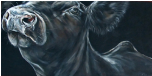
Kuva 5. Päivi Latvala: Angus Close Up (2005)

Miina Äkkijyrkkä tunnetaan monista lehmäaiheisista maalauksistaan, joissa hän on ikuistanut erityisesti kyyttöjä, joka tunnetaan myös Itäsuomenkarjana. Hän on toiminut kyseisen rodun puolestapuhujana, koska se on katoamassa kokonaan. Äkkijyrkkän teoksista olisin voinut valita minkä tahansa, koska kaikissa hänen teoksissaan, olivat ne sitten maalauksia, veistoksia tai suuria peltilehmiä, edustavat samaa arvostusta ja ihailua aihetta kohtaa. Äkkijyrkkä on taiteilijana profiloitunut niin, että hän käy teoksissaan samaa keskustelua tekniikkatavasta riippumatta. Syyt pohjaavat hänelläkin lehmiiin muodostuneeseen yhteyteen lapsuudenkokemuksien kautta. Eläimiin hän sanoi saavansa paremmin yhteyden kuin ihmisiin (Heinimäki 2009). Äkkijyrkkän mielestä lehmän valta on rauhoittavaa. Lehmän katseen lumo on jotain muuta kuin rahan lumo tai lumeksiva valta (Sandberg, 23.10.2007).