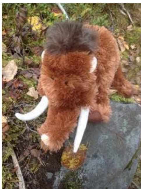
Kuva 2. Mammutti-pehmolelu.

Halusimme käyttää toiminnassamme erilaisia materiaaleja sekä välineitä, kuten sulkia, huiveja, palloja ja leikkivarjoja. Saimme hyödyntää myös päiväkodin välineitä toiminnassa. Valitsimme toiminnan teemaksi eri maiden eläimet, jotka yhdistimme musiikkiliikuntaleikkeihin. Etsimme internetistä eri maiden eläimistä kuvia ja askartelimme niistä kuvakortteja. Valitsimme myös suurimman osan musiikista eläinteemoihin sopivaksi. Saimme idean hyödyntää myös opinnäytetyön toiminnassa Mammutti-pehmolelua, koska eläinpehmolelu sopi toimintamme teemaan. Olimme opintojemme aikana hyödyntäneet pehmolelua ohjaustuokioissa ja mukavan ilmapiirin luomisen tukena. Pohdimme mistä voisimme löytää toimintaan sopivan pehmolelun ja lopulta löysimme Mammutti-pehmolelun Espoon Kaupunginmuseosta.