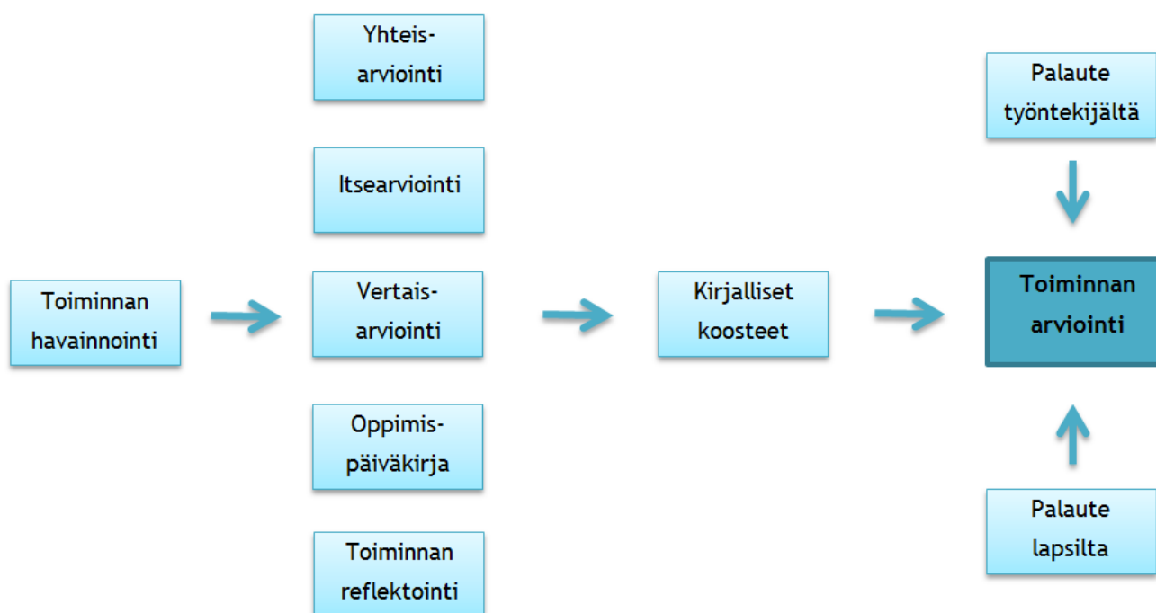
Kuva 1. Kuvassa on esitelty opinnäytetyön toiminnan arviointiprosessi. Kuvakaaviossa kuvataan arviointimenetelmien sekä toiminnan arvioinnin välisiä yhteyksiä.

Keskeisenä arviointimenetelmänä oli toiminnan havainnointi. Havainnoinnin apuna hyödynsimme yhteisarviointilomaketta, jonka täytimme jokaisen toimintakerran jälkeen yhdessä. Lomakkeeseen kirjasimme toiminnasta tehtyjä havaintoja ja lomakkeen apukysymykset (Liite 2) tukivat havaintojen kirjaamista.