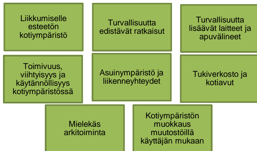
Kuvio 1. Kotona asumista tukevat tekijät.