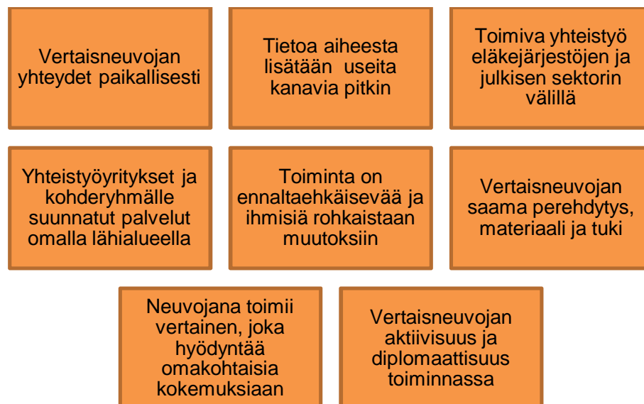
Kuvio 2. Kotona asumisen tukemista edistävät tekijät.