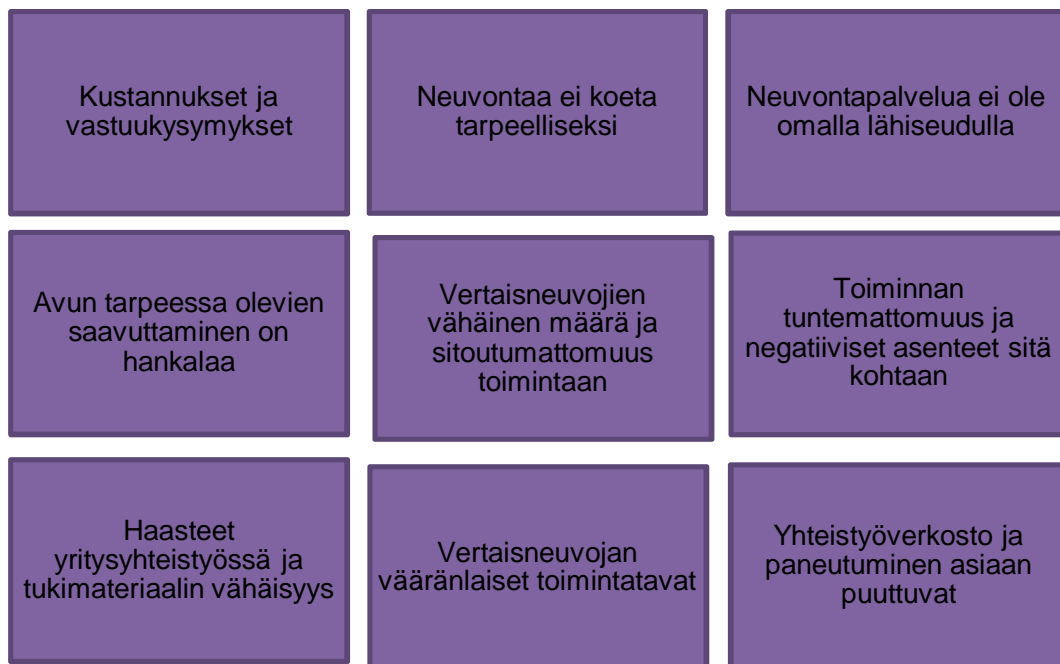
Kuvio 3. Kotona asumisen tukemista rajoittavat tekijät.