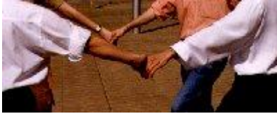
Kuvio 12. Kädet pidetään alhaalla lyhyen sarjan aikana. (Confederació Sardanista de Catalunya Saatavuus < http://fed.sardanista.cat/ > Iniciació Luettu 12.1.2016).