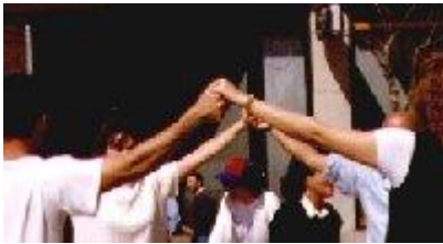
Kuvio 13. Kädet pidetään ylhäällä pitkän sarjan aikana. (Confederació Sardanista de Catalunya Saatavuus < http://fed.sardanista.cat/ > Iniciació Luettu 12.1.2016).