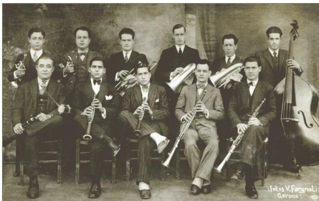
Kuvio 1. Cobla vuodelta 1932. Soittimet ylhäällä vasemmalta: 2 kornettia, venttiilipasuuna, 2 fiscornia, kontrabasso. Alhaalla vasemmalta: flabiol ja tamborí, 2 tibleä, 2 tenoraa. Kuva: Valentí Fargnoli. Kokoelma F. Sala . (Saatavuus < http://fotosformacionsmusicalsdecatalunya.blogspot.fi/2012/07/emporitana.html > Luettu 8.1.2016)

(Xarxa Telemàtica Educativa de Catalunya.)