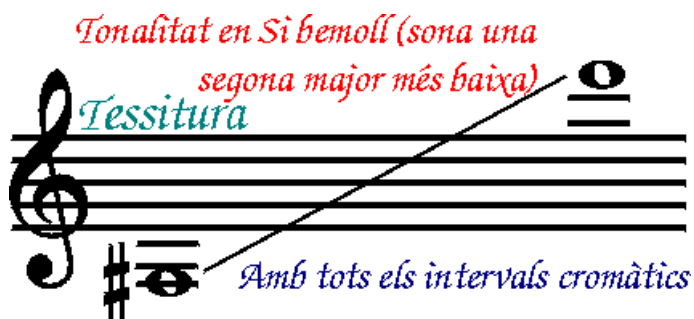
Kuvio 7. Tenoran ääniala. B-vireinen (soi sekunnin alemmaa). (Cobla Baix Llobregat Saatavuus < http://www.coblabaixllobregat.com/Tenora.htm > Luettu 7.1.2016).

Tible ja tenora ovat kehittyneet skalmeijasta ( xeremia ). Tarota , joksi niitä myös on kutsuttu ja jonka Gabriel Ferrer i Puig artikkelissaan La tarota, una xeremia d'ús popular a Catalunya otsikkonsa mukaisesti määrittelee soittimeksi, joka on "Kataloniassa yleisesti käytössä oleva skalmeija". Euroopassa keski-ajalla käytettyjä skalmeijoita käytettiin jatkuvasti myös renessanssin aikakaudella 1500- ja 1600-luvuilla. Silloin niitä soittivat