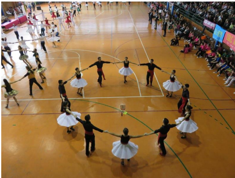
Kuvio 9. Grup Sardanista Maig -ryhmä sardana – kilpailuista Callellasta 2015. (Grup Sardanista Maig Saatavuus < http://www.grup-maig.cat/ > Luettu 11.1.2016).

Kuten jo mainitsin, sardana-ryhmien keskuudessa järjestetään myös kilpailuja. Yksi esimerkki näistä on Concurs del Campionat de Catalunya eli Katalonian mestaruuskilpailut, jotka järjestetään eri puolella Kataloniaa. (Confederació Sardanista de Catalunya.) Kilpailuissa kilpaillaan kaikissa eri ikäluokissa: pienet lapset, lapset, nuoret, aikuiset ja iäkäämmät aikuiset. (Unió de Colles Cardanistes de Catalunya.)