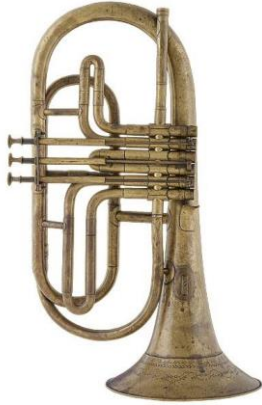
Kuvio 8. Fiscorn vuodelta 1840.