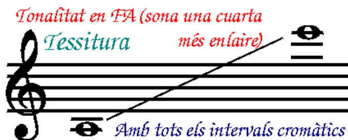
Kuvio 5. Tiblen ääniala. F-vireinen (soi kvartin ylempää). (Cobla Baix Llobregat Saatavuus < http://www.coblabaixllobregat.com/Tible.htm > Luettu 5.1.2016).

Tenora on tibleä hieman pitempi, 85 cm pitkä, ja sillä on kolmetoista läppää. Tiblen tapaan se koostuu kolmesta osasta, joista kaksi ylintä on tehty kiinanjuba -puusta, mutta alin osa on metallia (kuvio 6). Ensimmäisen tenoran rakensi Andreu Toron vuonna 1849 Pep Venturan toivomuksesta, joka oli ensimmäinen merkittävä tenoran solisti. Hänen