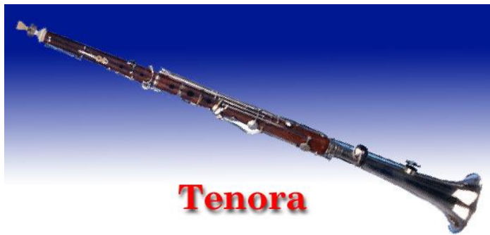
Kuvio 6. Tenora. Cobla Baix Llobregat (Saatavuus < http://www.coblabaixllobregat.com/Tenora.htm > Luettu 25.1.2016).

ansiostaan tenora on coblan tärkein soitin ja etenkin sardanassa soolot ovat tyypillisesti kirjoitettu sille. Soittimen rikas ja voimakas ääni tekee siitä hyvin ilmeikkään ja samoin kuin tible, se sopii erittäin hyvin ulkona soitettavaksi (niin kuin sardanaa useimmiten sojetaan). (Cobla Baix Llobregat; Cobla la Principal de Terrassa.)