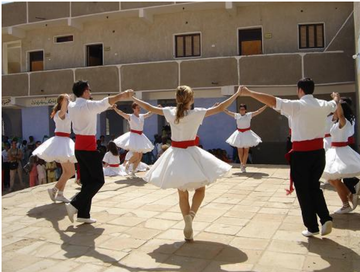
Kuvio 14. Sardana tanssijoiden vaatetus.

Sardanan vaatetukseen kuuluu naisille hame ja miehille housut. Molemmilla on nauha vyötärön ympärillä ja jaloissa espadenyes eli katalonialaiset tossut. Koska sardanaa voi