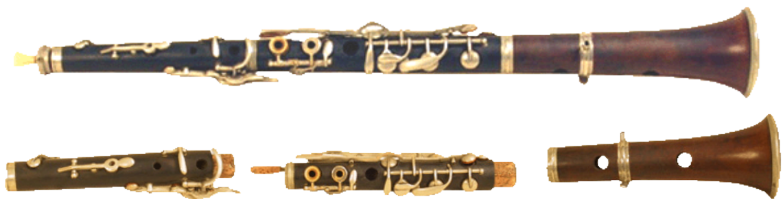
Kuvio 4. Tible. (Cobla Baix Llobregat Saatavuus < http://www.coblabaixllobregat.com/Tible.htm > Luettu 5.1.2016).

kovaa kiinanjuba-puuta (kuvio 4). Ylimmässä ja keskimmaisessä osassa sijaitsee läppäkoneisto ja alimmassa osassa on neljä reikää kokonaan ilman läppiä, jotka ovat aina auki. Tiblen korkean, kirkkaan äänen ja hieman nasaalin sävyn ansiosta se sopii erinomaisesti lisäämään voimakkuutta sardanaan. Sille on tyypillistä, että tanssin salt petit (pienen askeleen/hypyn) -osissa, se esiintyy duona toisen tiblen kanssa. Soitinta kuullaan harvoin yksin, vaan useimmiten coblassa, jossa sillä on merkittävä vastuu mm. sooloissa. (grups.blanquerna; Cobla Baix Llobregat.)