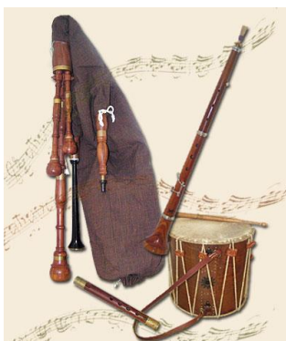
Kuvio 15. Cobla de tres quartans koostui yleensä cornamusasta (säckpipilli), tiblestä sekä flabiolista ja tamborísta . (grups.blanquerna Saatavuus < http://grups.blanquerna.url.edu/m46/catalans/cobla34.htm > Luettu 13.1.2016).