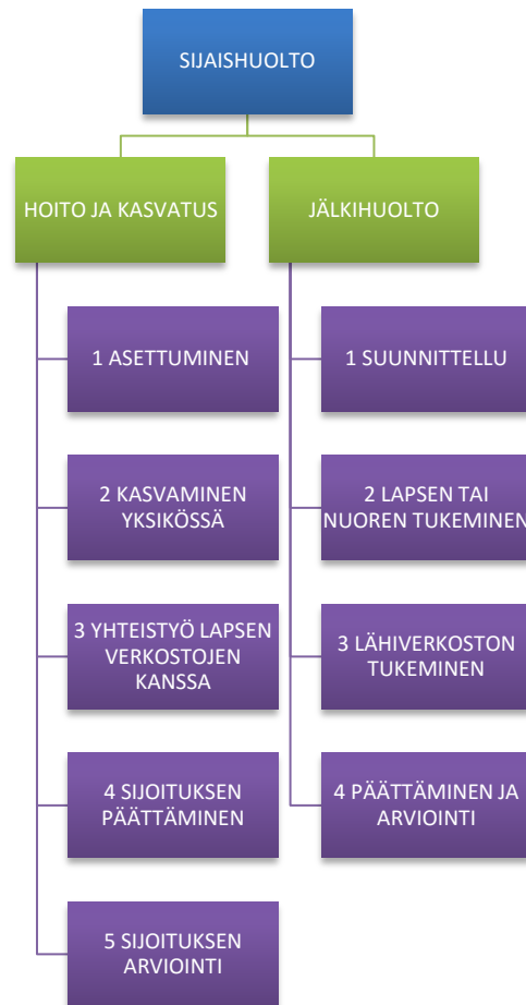
Kuvio 3. Sijaishuollon kokonaisuus (Sijaishuollon neuvottelukunnan julkaisuja 2004, 21, 28)

Lapsen tai nuoren kasvaminen sijaishuollon piirissä sisältää päämäärinä hoidon ja kasvatuksen yksilöllisen suunnittelun yhdessä sijaishuoltoapaikan (esim.lastenkodin), lapsen ja hänen perheensä kanssa. Lapsi pitää kohdata arvostavasti ja auttaa häntä luomaan läheisiä ja myönteisiä ihmissuhteita. Lapsen arkielämän tarpeista sekä arkielämän säännöllisyydestä pitää huolehtia niin, että lapsi oppii osallistumalla ottamaan ikätasonsa mukaista vastuuta asioistaan. (Sijaishuollon neuvottelukunnan julkaisuja 2004, 23-24)