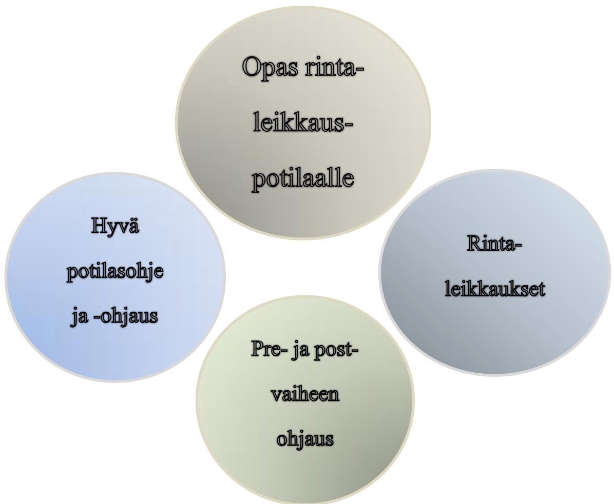
Kuvio 1. Teoreettinen viitekehys. Opinnäytetyön keskeiset käsitteet

Teoreettisiksi lähtökohdiksi valikoituivat työn aiheen kannalta oleellimmat avainasiat. Työssä käydään läpi potilasohjeen ja laadukkaan ohjauksen kriteereitä ja edellytyksiä sekä rintaleikkauksen kannalta tärkeitä pre- ja post- vaiheen asioita, jotka potilaan on hyvä tietää. Työssä on tietoa myös yleisimmistä rintarekonstruktioleikkauksista sekä fysioterapiasta.