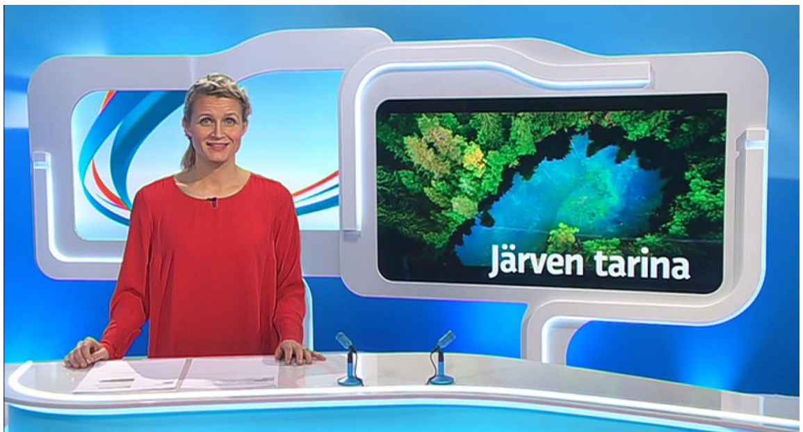
Kuva 1. Kaakkois-Suomen alue-uutiset 18.12.2015.

Journalistisessa uutistyössä, etenkin Yleisradiolla työskennellessä, on kuitenkin tiettyjä objektiivisuuden velvoitteita. Esimerkiksi haastattelussa kaikkia haastateltavia pyritään kuvaamaan silmien korkeudelta. Ala- tai yläkulmasta kuvaaminen antaisi tietynlaisia mielikuvia. Haastattelukuvassa rajausta on usein puolikuva, puolilähikuva tai joskus jopa lähikuva haastateltavasta. Haastateltava henkilö on yleensä aseteltuna kultaiseen leikkaukseen eli hieman joko kuvan oikealle tai vasemmalle puolelle. Kuvassa on tärkeää olla ylimääräistä tilaa sen ylä- ja alapuolella. Tämä on tärkeää, esimerkiksi siksi, että ruudun alapuolelle lisätään tv-lähetyksessä nimi-planssi eli "tegu".