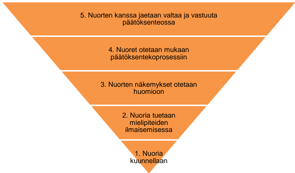
Kuvio 3. Osallisuuden tasot Shieriä mukaillen (Marjanen 2013: 81).

Toiseksi Shierin malli tarkastelee osallisuutta nuoren ja aikuisen välisen vuorovaikutuksen kautta ja aikuisen rooli nähdään nuorten osallisuuden mahdollistamisessa tärkeänä, kun taas Thomasin mallin kuudes ulottuvuus on nuorten tekemät itsenäiset päätökset. Koulussa nuoret ja aikuiset ovat vuorovaikutuksessa keskenään ja nuoret oppivat erilaisia vaikuttamismekanismeja.