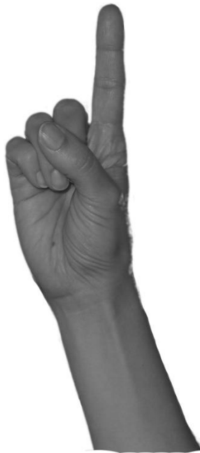
Kuva 2. Käsimuoto G.