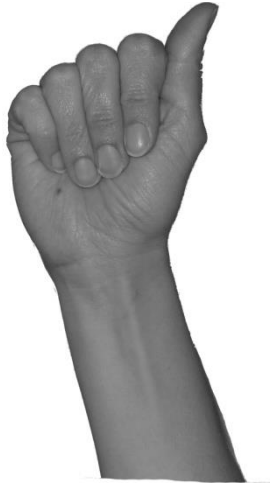
Kuva 3. Käsimuoto A.