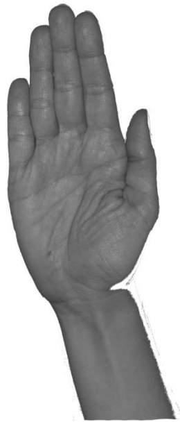
Kuva 4. Käsimuoto B.

Viittomien kuvauksissa on pitkään keskitytty käsiasentojen, eli käsimuodon ja käsien liikkeen mallintamiseen ja käsien keskeinen asema näkyy myös sanakirjoissa. Vaikka kasvojen ilmeiden toissijaisuus on tyypillistä suomalaisissa viittomasanakirjoissa, niin ilmeet (ja äänenpainot) auttavat kuitenkin lasta viestin vastaanottamisessa, sillä viittoja (tässä tukiviittomien käyttäjä) tuottaa sano-