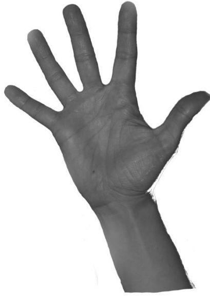
Kuva 1. Käsimuoto 5.