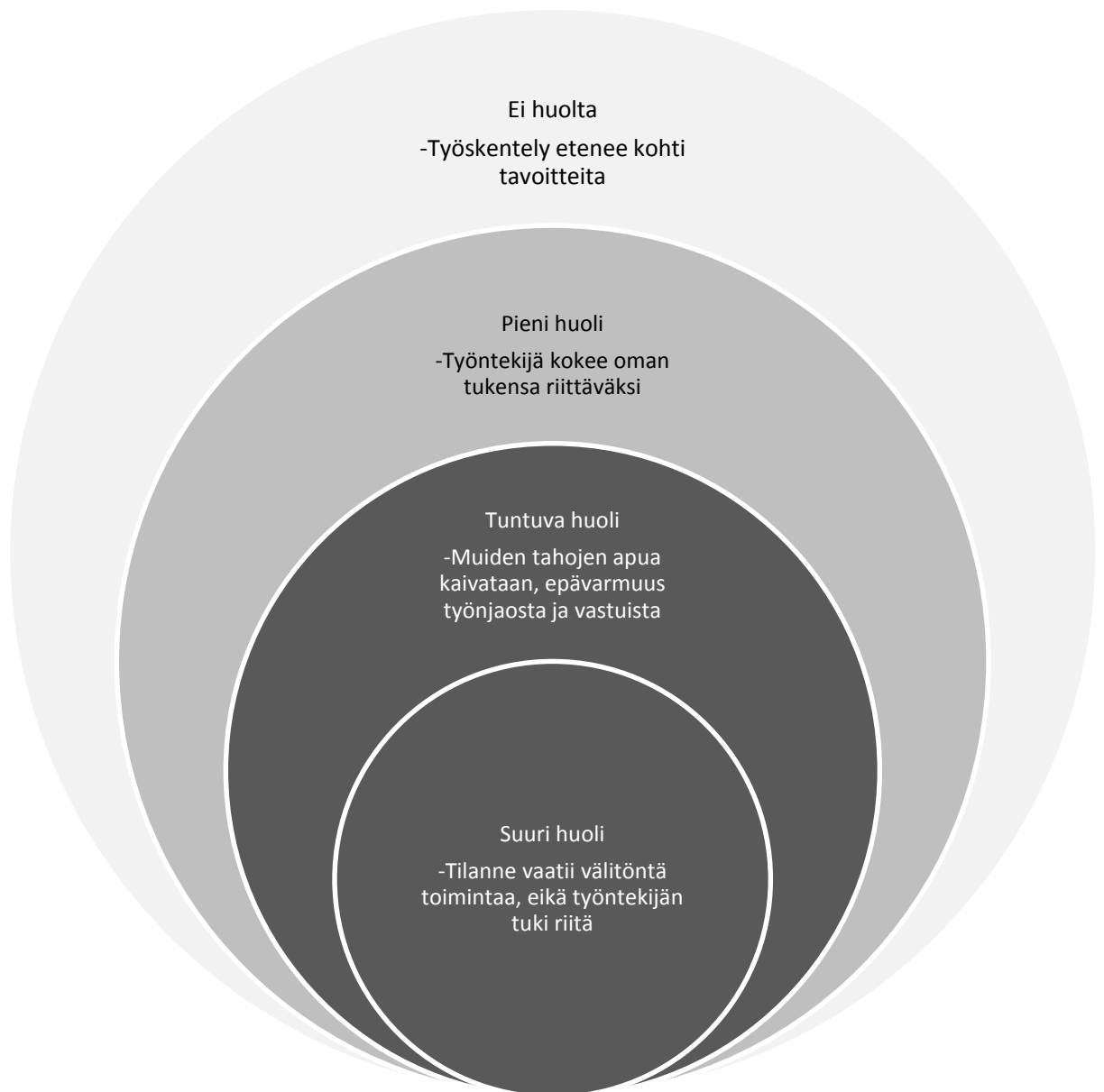
Kuvio 1. Huolen vyöhykkeistö

Maahanmuuttajataustaisten perheiden kohdalla huoli nousee pääosin samankaltaisista syistä kuin suomalaisillakin, mutta on myös joitain erityisiä taustatekijöitä, jotka vaikuttavat maahanmuuttajaperheiden elämässä enemmän. Maahanmuuttajataustaisissa perheissä voi esiintyä ristiriitoja vanhempien ja nuorten välillä, jos nuoret omaksuvat vanhempien vieroksumia länsimaisia tapoja. Lisäksi koulussa saattaa esiintyä oppimis- ja sopeutumisvaikeuksia erilaisen kielen ja kulttuurin vuoksi. Myös etnistä syrjintää ja kiusaamista lapset saattavat kohdata koulussa ja kavereiden kanssa. (Anis 2008, 149.)