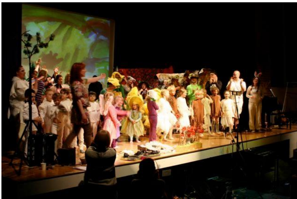
Kuva 3. Loppukumarrusten aika aplodien siivittäminä.

Koen, että Illusiassa henkilökunnan ja perheiden välit olivat jo ennestään toimivat ja lämpimät, joten projektin painopiste ei ollut niinkään aikuisten välisen luottamuksen lujittamisessa, vaan yhteisen voimaannuttavan kokemuksen synnyttämisessä. Voisi ajatella, että vanhemmat ja työntekijät olivat mukana projektissa nimenomaan tuomassa lisäarvoa lapsen kokemukselle eivätkä itse primääreinä kokijoina. Lapsi on vanhemmilleen maailman tärkein ja rakkain asia, ja Illusia puolestaan on olemassa nimenomaan lapsia varten. Niinpä projekti toteutettiin niin vanhempien ajatusmaailmaa kuin Illusian kasvatustilafilosofiaa ja toimintatapoja kunnioittaen – luova, ihana, ihmeellinen lapsi edellä.