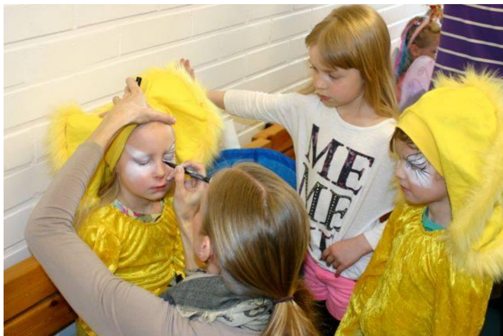
Kuva 1. Meikkaamista takahuoneessa ennen esitystä.

”Ei mua pelottanu siel esitykses. Paitsi se ku valot oli pimeenä siel esitykses ni mä pelästyin [yhtä tyttöä] ku sillä oli se meikki ja mä en nähny sen naamaa kunnolla, näky vaan ne valkoset. -- Ne näytti aika hurjilta pimeessä.” (L3)