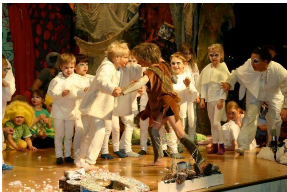
Kuva 2. Lumikon ja Pessin taistelu.

Yksi vanhemmista oli sitä mieltä, että projekti oli hyvää esiintymisharjoitusta hänen lapselleen ja voisi vaikuttaa siihen, että lapsi myöhemminkin hakeutuu johonkin vastaavaan. Toinen vanhempi kertoi uskovansa, että projektissa lapselle annettu vastuu ja onnistumisen ilo ovat asioita, jotka kantavat pidemmälle tulevaisuuteen.