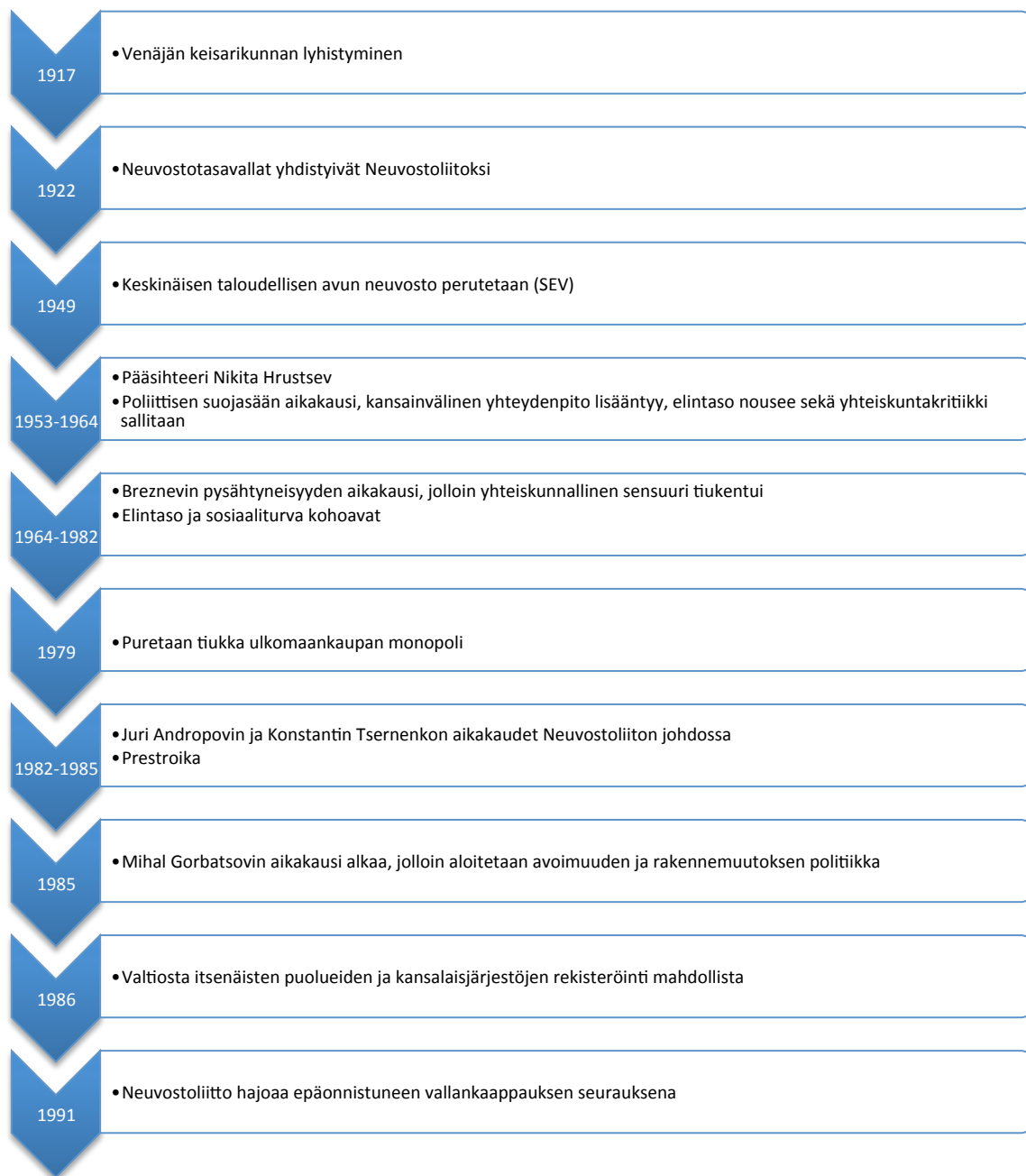
Kuva 1: Venäjän lähihistoria (Salmenniemi & Rotkirck 2008, 6)

Kuvio 1 esittää selkeästi Venäjän lähihistorian suurimmat muutokset sekä vaiheet: