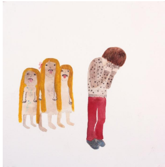
Kuva 3: Malin Ahlsved: Retflickor , 2011