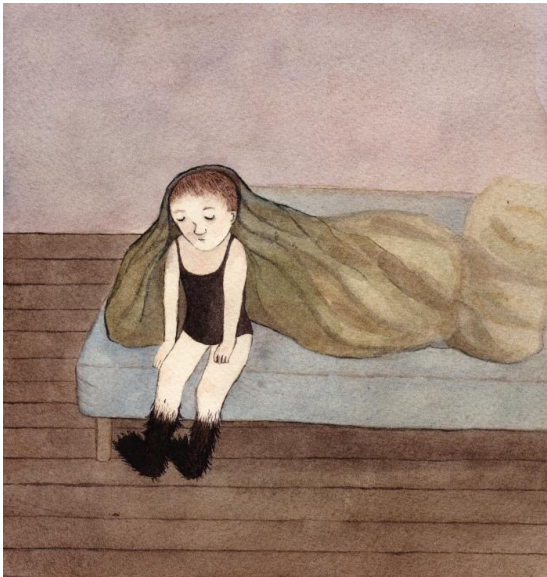
Kuva 4: Malin Ahlsved: Varmt om fötterna, 2014

Ahlsvedin töissä Varmt om fötterna ja Bomb on kummassakin jälleen yksinäinen hahmo. Tyttö tai nainen istuu sängyllä (kuva 4) väsyneen ja surullisen näköisenä. Hänen jalkansa ovat mustat ja karvaiset. Ehkä hän on masentunut, eikä jaksa vastata vallitsevaan kauneushanteeseen, jossa naisen säärtien on oltava sileät ja karvattomat. Hän kenties tuntee itsensä rumaksi tai huonoksi. Ulkonäköpaineet ovat nykyaikana suuret ja joskus jopa mahdottomat. Jos ei kykene vastaamaan niihin, voi tuntea itsensä rumaksi ja inhottavaksi, vaikka niin ei olisikaan.