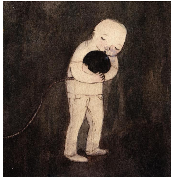
Kuva 5: Malin Ahlsved: Bomb, 2015

Joskus yksinäisyys ajaa epätoivon partaalle. Maailma on paha paikka. Kun kukaan ei ole soittanut kuukausiin, herää itsetuhoisia ajatuksia. Yksinäisyys ja ahdistus ovat niin niin voimakkaita, että kuolema tuntuu ainoalta ratkaisulta. Teoksessa Bomb (kuva 5) mies pitää tiukasti kiinni pommista, hän suorastaan haluaa sitä. Pommi on hänelle se, joka auttaa pois synkästä, ahdistavasta elämästä. Hän ei näe enää syytä elää.