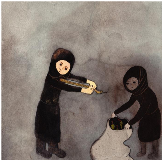
Kuva 2: Malin Ahlsved: Ormen , 2014

Kuvataiteilija Malin Ahlsvedin pienissä akvarelleissa on lapsenomaisia hahmoja, joille tapahtuu hurjia asioita. Teoksista tulee vaikutelma, että nämä hahmot ovat hyvin yksinäisiä ja joistakin hahmoista välittyy sellainen vihan tunne, jota ulkopuoliseksi jäänyt voi kokea. Teokset ovat tummasävyisiä, tai väliin hilpeänkin värisiä, mutta hilpeät värit ovatkin vain pintaa. Alaspäin suunnatut katseet viestivät surumielisyyttä, mustat pilvet ahdistusta tai synkkiä ajatuksia. Teoksessa Ormen (kuva 2) toinen hahmoista kiskoo käärmettä, paha oloa tai pahuutta sisuksistaan. Toinen pitää säkkiä, jonne paha olo piilotetaan. Teoksessa Retflickor (kuva 3) on neljä hahmoa, joista kolme ovat keskenään samannäköisiä ja ovat jättäneet neljännen, erinäköisen henkilön ryhmän ulkopuolelle ja kiusaavat häntä. Jo teoksen nimi Retflickor viittaa kiusaamiseen.