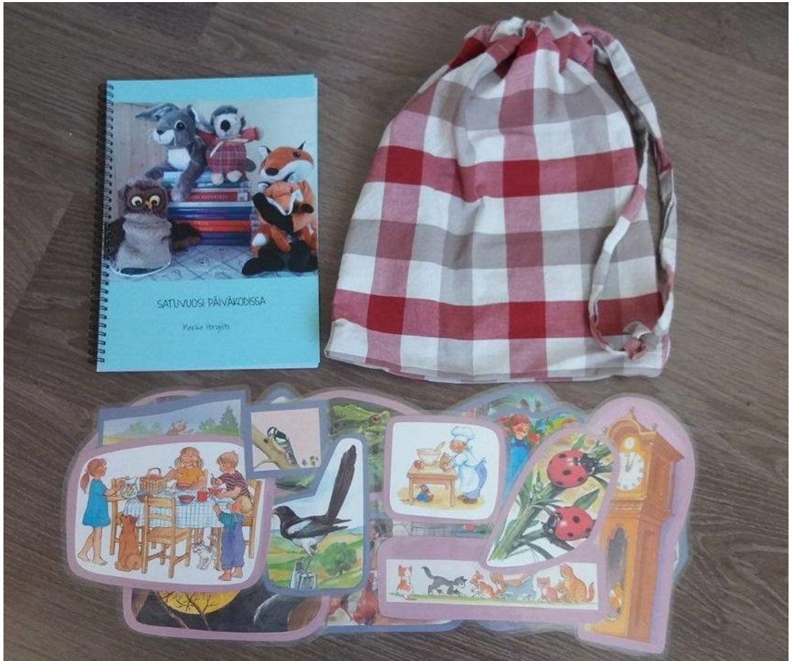
Liite 3. Satuvuosi päiväkodissa -opas, lorupussi ja lorukortit