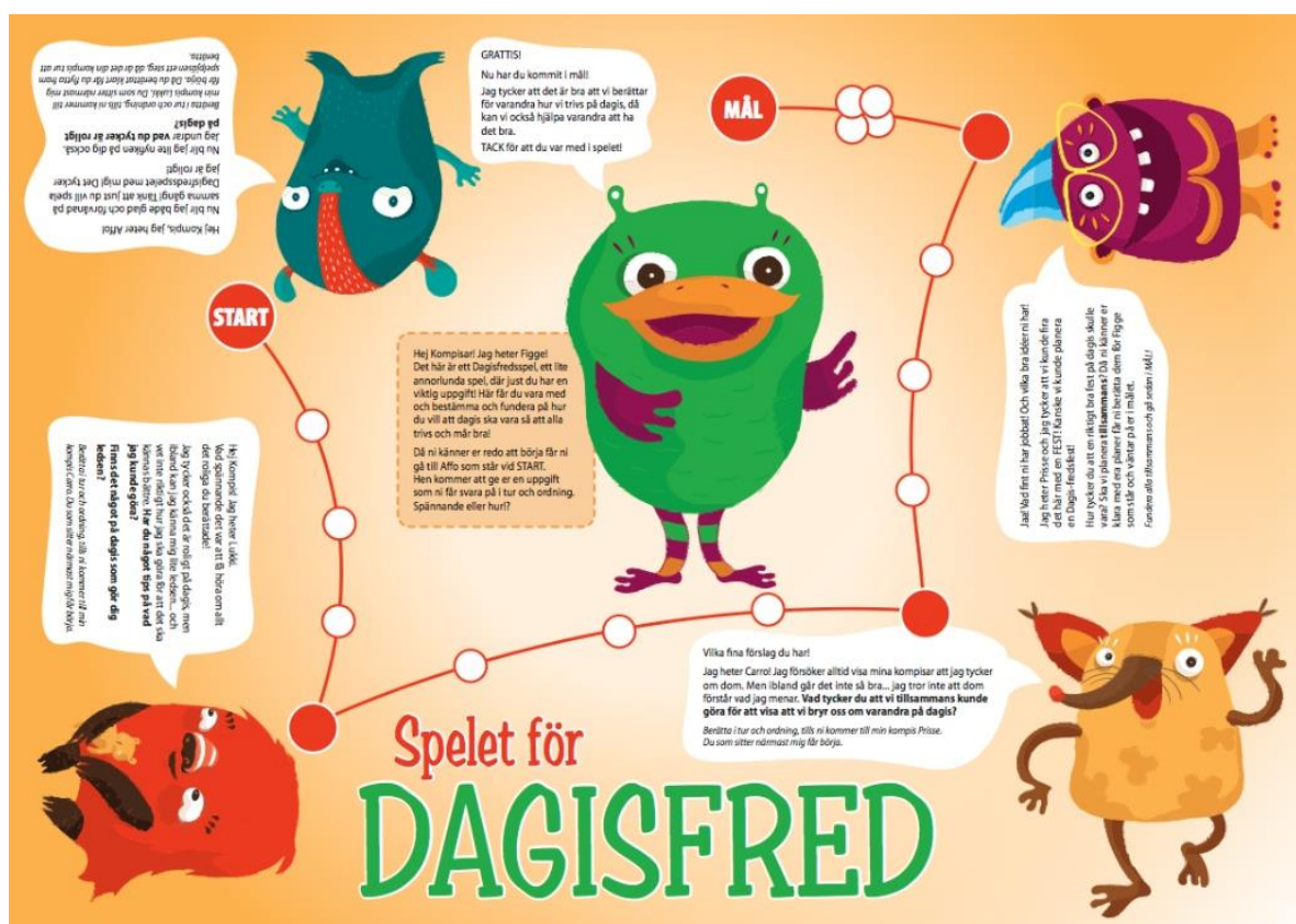
Figur 1 Spelet för Dagisfred (Spelet för Dagisfred)

Spelet spelas av fyra barn åt gången tillsammans med en pedagog, vars uppgift är att läsa upp instruktionerna och frågorna samt dokumentera barnens svar. Spelet går ut på att förflytta en gemensam spelpjäsa på spelplanen från figur till figur i den ordning de kommer. Varje figur berättar kort om sin situation och har sedan en tillhörande fråga som barnen i tur och ordning får fundera kring och sedan besvara enligt hur de tycker och tänker. Vartefter barnen svarat på frågorna får de flytta spelpjäsen framåt.