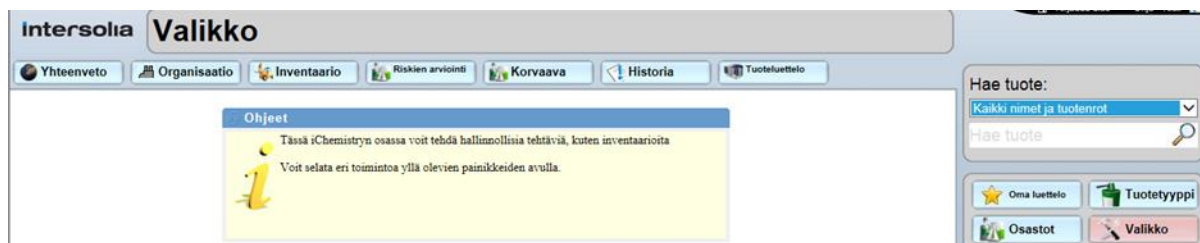
Kuva 4. iChemistry valikko näkymä (34)