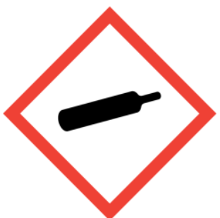
Sisältää paineen alaista kaasua