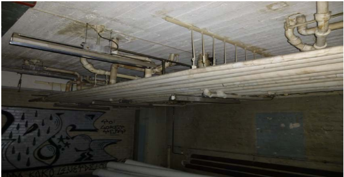
Kuva 5. Asbestia sisältäviä putkieristeitä kohteessa.

Kohteessa asbestipurku kannattaa luultavammin suorittaa ainakin hallitilassa ensimmäisenä pois ennen muiden työvaiheiden aloittamista. Näin asbestipurun osastointi voidaan suorittaa laajemmin ja varmistetaan sen, että tarpeeksi tilaa jätteiden säilyttämistä varten. Osastoidulle alueelle voidaan myös ennen työn alkua ajaa asbestijätelava sisälle, koska tilaan on mahdollista ajaa kuorma-