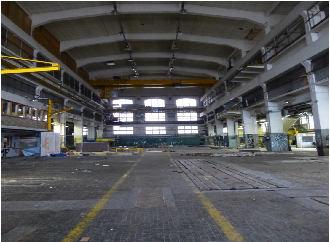
Kuva 2. Konehalli sisältä.

Tutkimuksessa tutkittiin tyypillisiä materiaaleja, jossa asbestia voi esiintyä, maalipintoja mahdollisten raskasmetallien vuoksi ja materiaaleja, jotka voivat olla vaarallista jätettä. Myös konepajan puupölkky lattiat, betonilattiat ja tiiliseinät tutkittiin, ja niiden todettiin sisältävän terveydelle haitallisia aineita. Rakennuksen alla olevaa maaperää ei ole tutkimuksissa tutkittu, mutta lattia on paikoin niin pahasti pilaantunut, että voidaan olettaa ainakin jonkin verran haitta-aineita päässeen maaperään ajan saatossa. Kuvassa 2 näkyy hallin päätila ja puupölkky lattiaa. (Vahanen.)