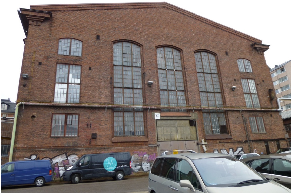
Kuva 1. Hietalahden konepajahalli.