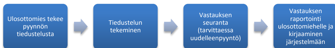
KUVA 2. Tiedonhankinnan prosessi

Edellä mainituista tiedonantovelvollisista ERP-sihteerin tekee tiedustelut lähinnä UK 3:67 §:ssä mainituille viranomaistahoille ja UK 3:66 §:ssä mainituille luotto-, rahoitus- ja vakuutuslaitoksen kaltaisille sivullisille. ERP-sihteerin tekee tiedusteluja erikoisperinnän velallisista. Alla olevasta kuvasta selviää tiedustelujen prosessi.