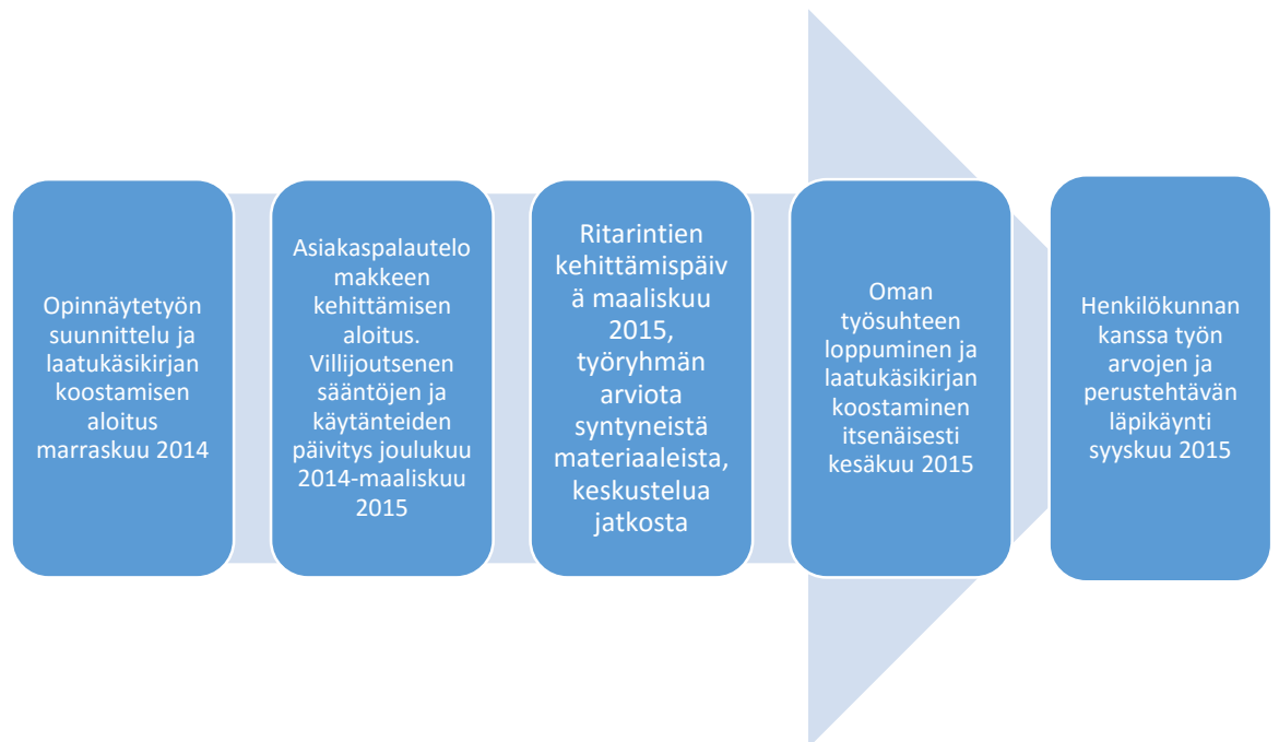
Kuvio 1 laatuprojektin aikataulu

Syksyllä 2015 osallistuin kummankin yksikön henkilökuntapalaveriin. Tällöin työryhmät saivat määritellä oman työnsä arvoja ja perustehtävää pienryhmissä. Tavoitteena oli nähdä, eroaako nykyinen näkemys siitä, miten asiat olivat ilmaistu vanhassa laatukäsikirjassa.