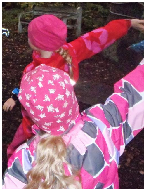
Kuva 1 Keveät perhoset

Ensimmäisen draamakerran alkaessa lapset vaikuttivat kiinnostuneilta ja energisiltä. Teimme ison piirin, kun lastentarhanopettaja oli kutsunut lapset paikalle ryhmän omalla kutsuhuudolla. Tunnelma oli odottava, joten menin suoraan asiaan tervehtimällä ja antamalla ohjeet tutustumisleikkiin. Aloitin kierroksen itse ja lapset ymmärsivät hyvin mistä on kyse. Kierros tuli käytyä pikaisesti ja nimen oheen keksitty liike oli joillain samankaltainen kuin vieruskaverilla, mitä osasin odottaa. Heti seuraavaksi leikittiin taikasauvaleikkiä, johon lapset lähtivät myös hyvin mukaan. He muun muassa liitelivät perhosina ja tömistelivät elefantteina, mutta paahtoleipänä pomppiminen näytti olevan erityisen mieluisaa.