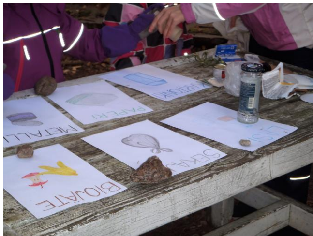
Kuva 6 Lajitteluleikki

Piirissä käydyn keskusteluhetken jälkeen pääsimme liikkeelle paperinkeräysjumpan myötä. Leikki oli lapsista huvittoman hauska. Kerroin ääneen