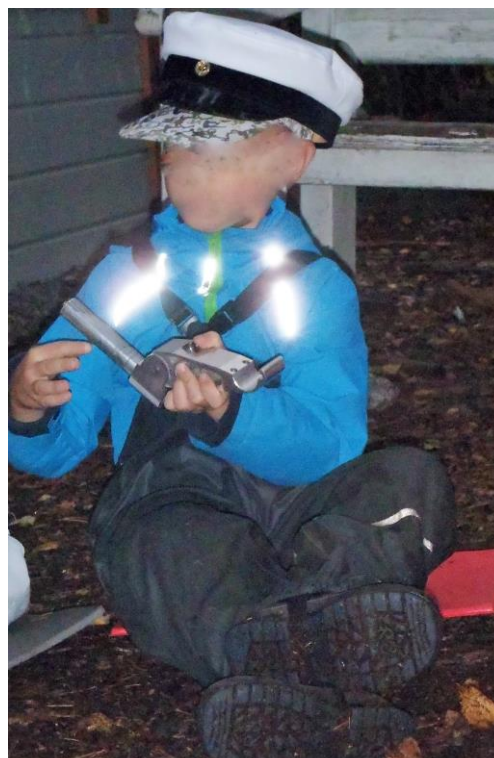
Kuva 4 Asiantuntija

Ensimmäisen tarinaosuuden jälkeen tutkittiin outoa esinettä (oikeasti polkupyörän osa), joka kiersi piirissä kädestä käteen. Sen todettiin olevan metallia ja siinä oli liikkuvia osia ja numeroita. Esittelin lapsille viisauden tuolin, jonka virkaa toimitti punainen istuinalusta, muiden istuessa vihreillä. Asiantuntijat saivat viisauden tuolissa istumisen ajaksi päähänsä asiantuntijahatun, jona toimi ylioppilaslakki. Moni lapsi halusi tulla esittämään näkemyksensä esineen käyttötarkoituksesta ja jokainen ehdotus kirjattiin ylös. Asiantuntijan rooli vaikutti kiehtovan lapsia, sillä osa tuli viisauden tuoliin vain kertoakseen kannattavansa jotakin aiemmin mainittua ehdotusta. Lasten ideat tämän oudon tavaran nimeksi olivat maankaivaja, puunhakkausväline, raudanväännin, talomurskain, vaaka sekä ruuvimittari. Arpomalla valittiin, että outoa tavaraa kutsutaan jatkossa ruuvimittariksi.