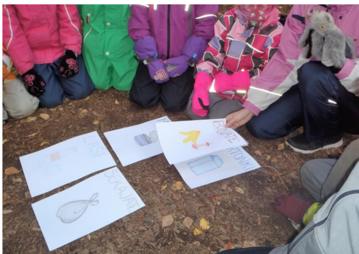
Kuva 5 Pöllövaari neuvoo

Otin esiin tekemäni kuvat kuudesta kierrätysastiasta ja arvuuttelimme Pöllövaarin kanssa, mikä mikin on. Lapset tunnistivat taitavasti kuvien merkitykset. Tässä vaiheessa Pöllövaari lähti päiväunille ja minä kerroin lapsille lajittelu-leikin ohjeet sekä laitoin tuomani roskat ja kierrätysastian virkaa toimittavat kuvat esille. Harjoitus toimi hyvin ja