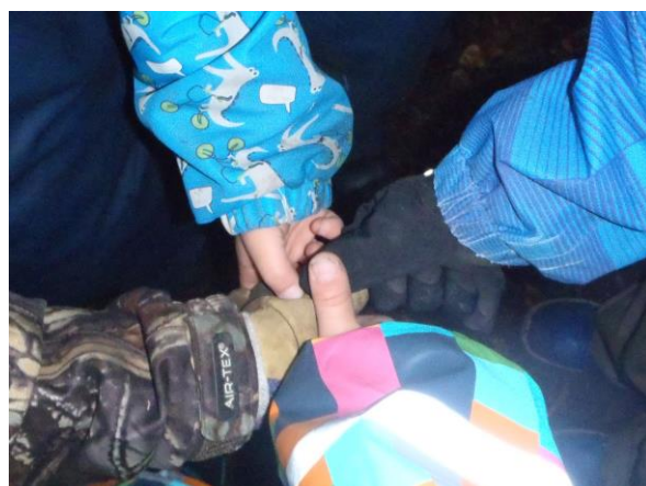
Kuva 3 Neljä peukaloa

Tässä vaiheessa istuttiin vielä hetkeksi alas ja kysyin lapsilta, mitä he tietävät jokamiehen oikeuksista eli siitä, mitä luonnossa saa ja ei saa tehdä. Liitin kysymyksen aiempaan keskusteluun siemenistä ja marjoista, joita on lupa kerätä. Lapset yllättivät positiivisesti tietämyksellään, ja näitä asioita oli selvästi mietitty niin kotona kuin päiväkodissakin. He kertoivat lähinnä asioista, joita ei saa tehdä, kuten luvaton