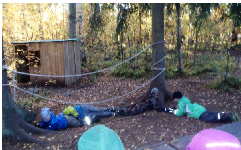
Kuva 7 Tabletin lataus

Lapset olivat edelleen aktiivisia keskustelijoita ja pyrin kuuntelemaan heitä tarkkaan ja kannustavasti. Totesin keskustelun lopputulemana kodalla vietettyjen päivien säästävän paljon energiaa. Jaoin lapset kolmeen ryhmään ja ohjasin tekemään vielä pantomiimiesitykset muulle ryhmälle johonkin energiansäästötapaan liitty-