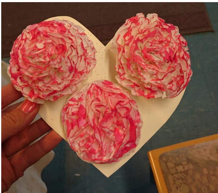
KUVA 1. Valmis kortti ja suodatinpussikukat.

Aloitin toiminnan esittelemällä itseni ja kertomalla, mitä välineitä meillä on käytettävissä. Olen aina itse tykännyt opetella uutta, joten olin harjoitellut tekemään suodatinpussikukkia. Tytöt innostuivat todella paljon, sillä he eivät olleet aikaisemmin tehneet kyseisiä kukkia (kuva 1). Osa teki kukkakimppuja ja osa liimasi kukkia suoraan korttipohjiin. Toimintaa rajoitti ainoastaan käytettävissä olevat materiaalit. Kaikilla oli muuten täysi oikeus tehdä juuri sellaisia kukkia, kun itse tahtoi. Lisäksi kaikilla oli myös oikeus olla tekemättä kukkia tai äitienpäiväkortteja, mikäli ei kokenut sitä tarpeelliseksi. Askartelu herätti toiminnan aikana paljon keskustelua, jonka johdosta meillä muodostui selkeä yhteys toistemme välillä.