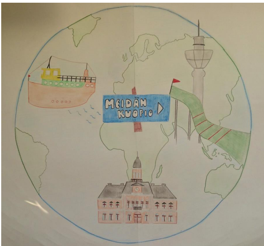
KUVA 5. Pohja kehittämisisideoiden keräämiseen.

Opinnäytetyössäni sovelsin Peavyn luomaa elämänkentän mallia yhtenä kehittämismenetelmänä. Muodostin Peavyn elämänkenttäteorian pohjalta meidän Kuopio elämänkentän (kuva 5), jonka kautta toteutin kehittämisisideoiden keräämisen. Kehittämismenetelmässä nostin esille vain kehittämisprosessin kannalta olennaisen näkökulman, jonka tarkoituksena oli selvittää, minkälaisia toimintamuotoja tytöt tahtoisivat Kuopioon. Eritoten toimintamuotoja, joita Kuopion Setlementti Puijola ry pystyisi toteuttamaan, jonka vuoksi elämänkentän rajaaminen oli perusteltua.