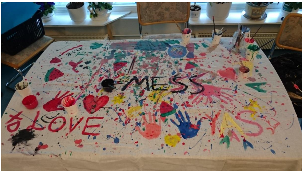
KUVA 3. Keskeneräinen kangas.

harjoittelussa heittäneet maalia lakanaan, mikä osoittautui kaikille todella hauskaksi kokemukseksi, joten ehdotin tytöille kiinnostaisiko heitä lakanaan maalaaminen. Jälleen idea oli uusi ja erilainen, minkä vuoksi tytöt innostuivat ja toivoivat, että toisin paljon eri värejä. Kyseisenä tiistaina herätimme henkiin sisäiset taiteilijasielumme ja kaikki saivat maalata lakanaan sitä, mikä hyvältä tuntui (kuva 3). Maalia roiskui ympäri asukastupaa ja lopuksi pesimme niin vaatteita, kun lattioitakin. Lisäksi paikalle saapui taas kaksi uutta tyttöä, joista toinen oli jo aikaisemmin kerhossa käyneen tytön isosisko ja toinen oli isosiskon kaveri. Kerhon aikana me kaikki lauloimme musii-kin tahdissa ja samalla maalasimme lakanaa, joten tunnelma oli todella iloinen, niin minulla kuin tytöilläkin.