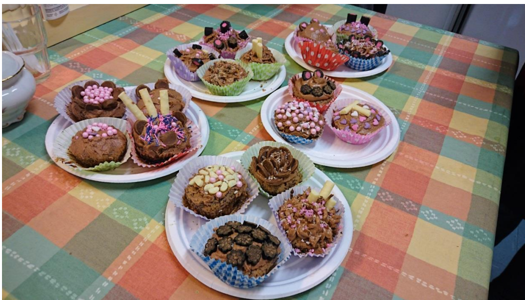
KUVA 2. Valmiit kuppikakut.

Leivontakerralle saapui jälleen uusi tyttö. Paikalle saapuneet tyttö oli kuitenkin tällä kertaa entuudestaan tuttu edellisten harjoittelujen kautta sekä tytöt tunsivat toisensa entuudestaan, joten hänet otettiin hyvin vastaan eikä tilanne vaatinut erillistä tutustumista. Kyseisellä kerralla meidän oli tarkoitus leipoa alusta alkaen, mutta Kohtaamispaikka Kotikulmassa ei ollut uunia, joten jouduin hieman alustamaan leipomista kotona. Tein kotona kuppikakut valmiiksi ja asukastuvalla tytöt saivat itse valmistaa kreemin ohjeiden avulla, minkä jälkeen kaikki saivat koristella neljä kuppikakua itse tehdyillä pursottimilla (kuva 2). Koristelu oli kaikille uutta. Kukaan ei ollut aikaisemmin päässyt koristelemaan leivoksia eikä valmistanut itse raaka-aineista kreemiä. Tytöt olivat iloisia ja tasainen puheensorina valtasi koko tilan. Lisäksi pelasimme vielä loppuun Aliasta, jonka yhteydessä tytöt olivat energisiä ja elämäniloa pursuavia. Samalla söimme tekemiämme leivoksia ja joimme mehua.