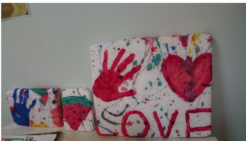
KUVA 4. Valmiita tauluja.

Paikalle saapuivat tytöt, jotka olivat käyneet kerhossa eniten koko kevään ajan eli ryhmä, joiden toiveista kaikki tekeminen oli lähtenyt. Tunnelma oli alkuun hieman jännittynyt, sillä tytöt eivät tienneet, mistä oli kyse, kun tilassa oli kaksi muuta naista minun lisäksi. Tilanne kuitenkin raukesi, kun Kuopion Tyttöjen Talon henkilökunta kertoi, mistä he tulevat ja miksi he tulivat, minkä jälkeen aloitimme luonnollisen toiminnan. Olimme sopineet maalauksen yhteydessä muutama viikko takaperin, että voisimme tehdä lakanasta tauluja. Osa tytöistä oli kyseisellä kerralla ollut pois, joten kaksi tyttöä osasi kertoa, mistä oli kyse. Siirryimme tutustumisen jälkeen taas luonnollisesti ison pöydän ääreen, jossa ryhdyimme hommiin (kuva 4).