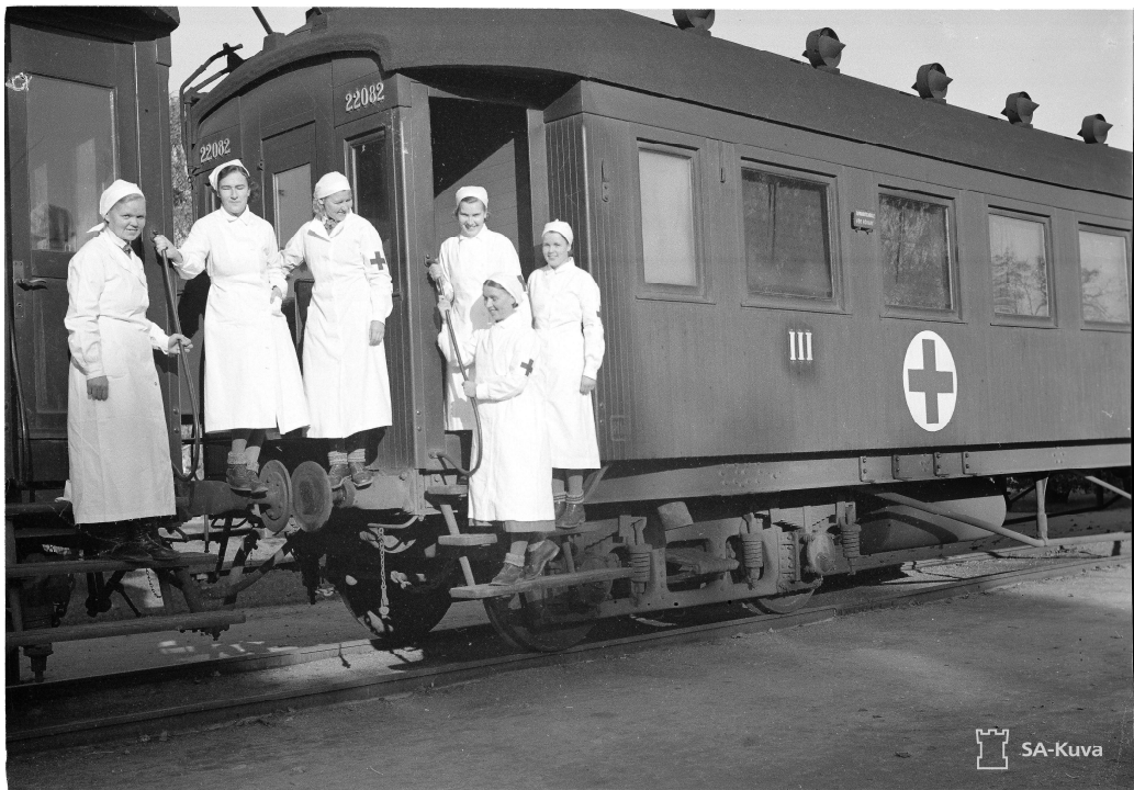
Kuvio 7. Sairaanhoidajat sairasjunassa Viipurin asemalla 1.10.1939.