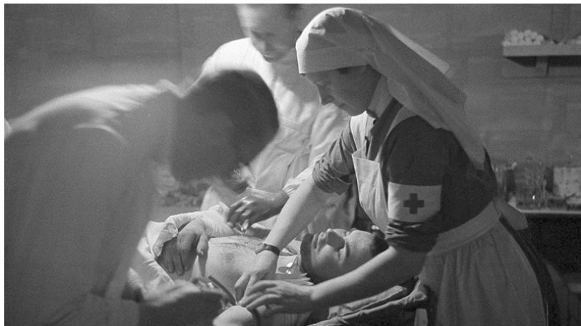
Kuvio 3. Hoitaja avustamassa lääkäriä toimenpiteessä (Sairaanhoitajat sodassa).

vastuuta potilaiden hoidosta sekä hoitamaan työnsä ammattimaisesti ja empaattisesti. Sairaanhoitajien toiminnasta näkyi sitoutuneisuus työhön sekä tarve, halu ja kyky toimia yhteistyössä muun henkilökunnan kanssa. (Virtanen 2005: 208.) Sairaanhoitajat toimivat omissa tehtävissään sekä välillä ylihoitajan tehtävissä todella haastavissa ja aavistamattomissa olosuhteissa. Sodan rauhallisina ajankohtina sairaanhoitajat saivat palata sotasairaloista siviilisairaaloiden avuksi. (Virtanen 1991b: 11–15.) Yksi tärkeä osa sairaanhoitajan työssä oli huolehtia potilaiden mielialasta ja tukea heitä henkisesti (Virtanen 2005: 225).