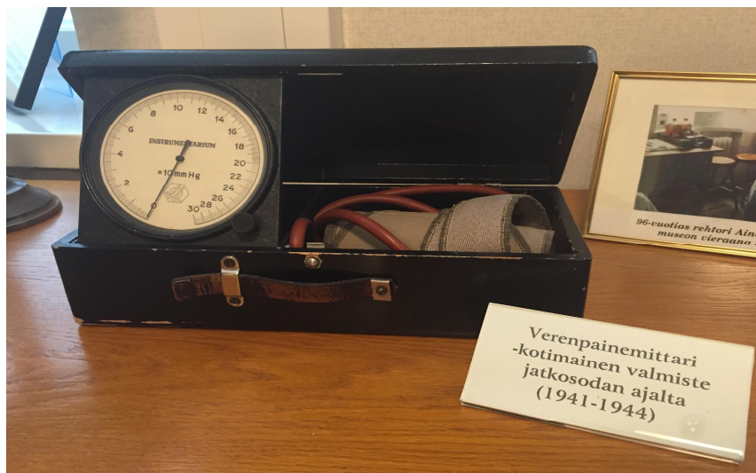
Kuvio 2. Verenpainemittari jatkosodan ajalta. (Husu ja Kinnarinen 2016.)

Sairaanhoitajien määrä pyrittiin lisäämään jo talvisodan aikana. Uusia sairaaloita perustettiin ja sen hetkiset toimivat sairaalat pyrkivät laajentamaan toimintaansa. Talvisodan alkaessa sairaanhoitajia erilaisissa lääkintätehtävissä oli 3450 ja loppuvaiheessa määrä oli kasvanut jo 5500 sairaanhoitajaan. Apuna talvisodassa toimi myös ulkomaalaisia sairaanhoitajia Ruotsista, Norjasta ja Tanskasta noin pari sataa. (Halme – Ollikainen 2003:13.) Kun kesäkuussa 1941 määrättiin yleinen liikekannallepano, siirtyivät sairaanhoitajat samoihin sodanaikaisiin hoitopaikkoihin. Heistä yli puolet siirtyi työskentelemään sotasairaaloihin. (Virtanen 2005: 165.) Jatkosodan alussa sairaanhoitajia oli sijoitettuna 4800 ja määrää lisättiin taas sodan aikana. Vuonna 1944 jatkosodan loppuaikana sairaanhoitajia oli jo 5500 pelkästään sotasairaaloissa töissä. (Halme – Ollikainen 2003:13.) Kesällä 1941 myös lotat saivat liikekannallepanomääräyksen. Lottia sijoitettiin kenttäsairaaloihin, sotasairaaloihin, sairaalajuniin, sairaalalavoihin, sotavankisairaaloihin, laboratorioihin, kenttäapteekkeihin, lääkintäkeskusvarikolle, veripalvelutoimintaan ja kaatuneiden evakuoimiskeskukseen. (Virtanen 2005: 166.) Lotat olivat tärkeä osatekijä potilaiden hoidossa. Leikkaussalin sairaanhoitajien kanssa eniten lotista toimivat yhteistyössä lääkintälotat. (Heinilä 1999: 24–29.)