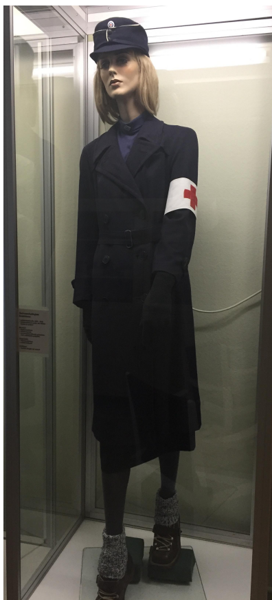
Kuvio 5. Sairaanhoidajan kenttäasu sotatoimialueella 1939–1945. (Husu ja Kinnarinen 2016.)

Tilanteet saattoivat muuttua nopeasti ja sairaalat vaihtoivat usein paikkaa. Päälikkölääkäri saattoi ilmestyä leikkaussaliin ja ilmoittaa kenttäsairaalan vaihtavan paikkaa ja uuden sairaalan tuli olla toimintavalmiina uudessa paikassa seuraavana aamupäivänä. Sairaaloitten oli pysyttävä sotilaiden mukana. Muutoissa sairaanhoitajat joutuivat pakkaamaan tavaroita kiireessä, määrättyssä järjestyksessä ja mahdollisimman puhtaasti. Esimerkiksi parissa tunnissa yksi leikkaussali oli saatu kuljetusvalmiuteen ja uudessa paikassa leikkaussali oli saatu pystyyn nopeasti ja 15 minuutin kuluttua saattoi pöydällä olla jo potilas. (Me autoimme: sairaanhoitajien sotamuistelmia 1951: 39.)