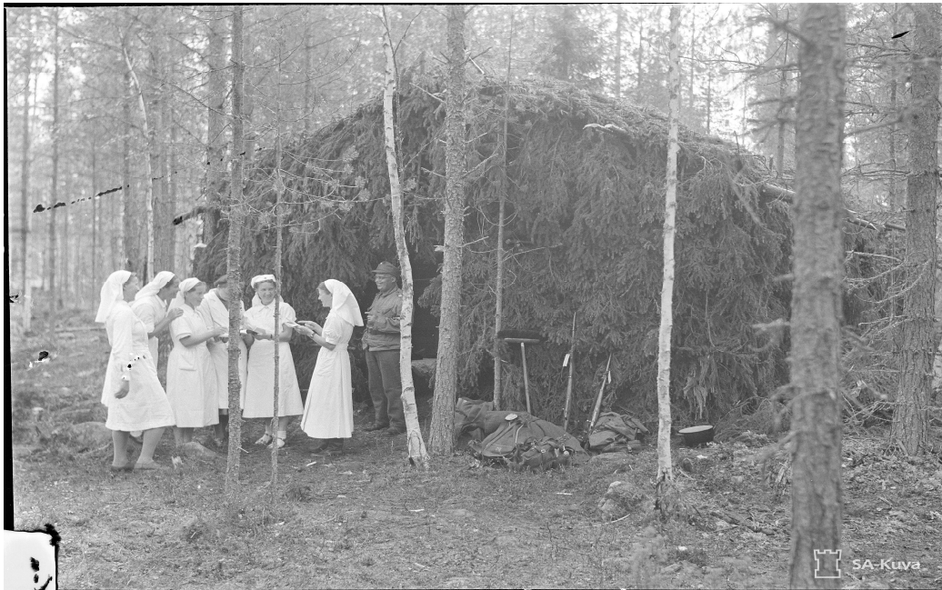
Kuvio 6. Sairaanhoitajia kenttäsaairalan ulkopuolella 9.7.1941.

Kenttäsaairaalat toimivat sotatoimialueella, joissa sairaat ja haavoittuneet saivat sekä konservatiivista että operatiivista hoitoa. Kenttäsaairalaan saapuneet potilaat olivat usein saaneet jo ensiapua sidontapaikoilla ja tarvitsivat usein sairaalaan tullessaan kirurgista hoitoa. Tärkeimpänä tehtävänä kenttäsaairalassa olivatkin akuutit toimenpiteet, johon kuului muun muassa haavojen puhdistaminen, verenvuotojen tyrehtyttäminen, murtumien oikominen, kipsaukset sekä leikkaukset. Kenttäsaairaloissa ei ollut käytössä antibiootteja ja sen takia moni potilas ei selvinnyt. Verensiirtoja pystyttiin kuitenkin tekemään ja käytössä oli O-verta, jota säilytettiin virvoitusjuomapulloissa ja verta saatiin pääsääntöisesti kotirintamalta. (Virtanen 2005: 124–129.) Verensiirto saattoi tapahtua joskus suorana siirtona potilaalta toiselle. Nestehoitoa toteutettiin pitkällä neulalla suoraan reiden lihakseen hitaasti tai nestettä annettiin letkulla peräsuolen kautta. (Halme 2007: 52). Nukutusaineena käytettiin eetteriä, ja lääkkeinä oli muun muassa aspiriinia, kodeiinia, morfiinia ja heroiinia. (Virtanen 2005: 124–129.)