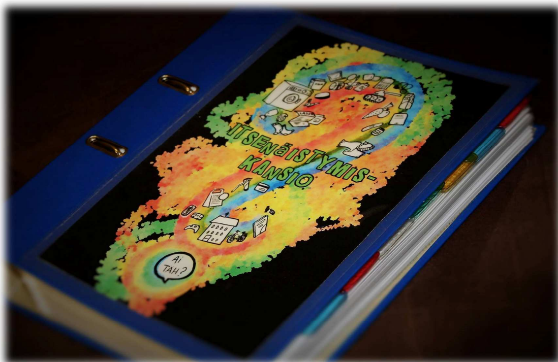
LIITE 1: Kuva itsenäistymiskansion kannesta