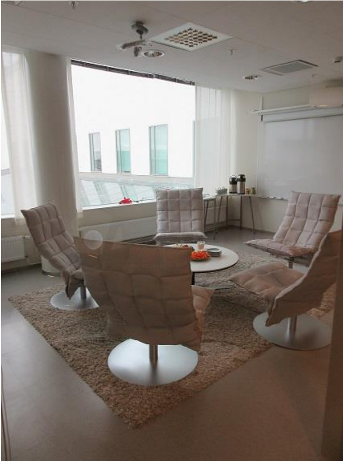
KUVA 1. Kokoushuone