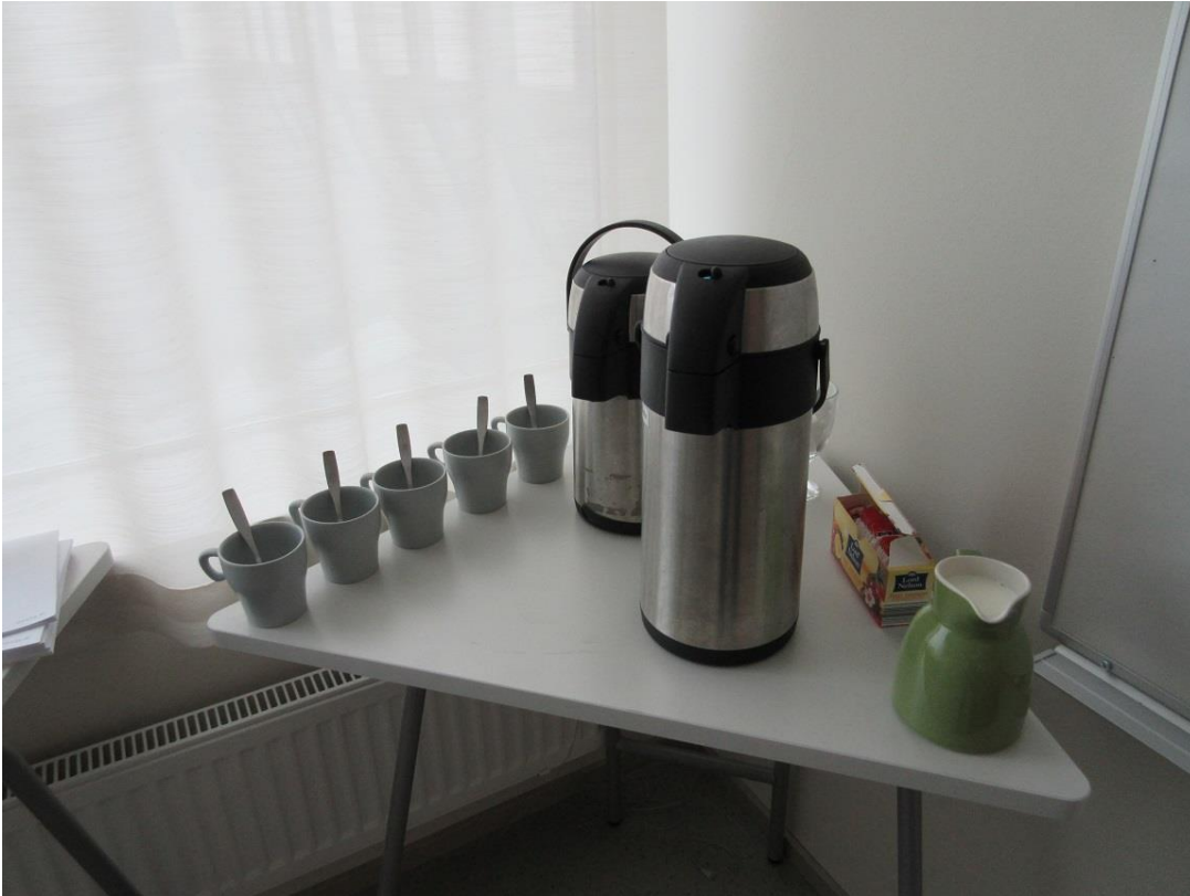
KUVA 3. Kokousjuomat