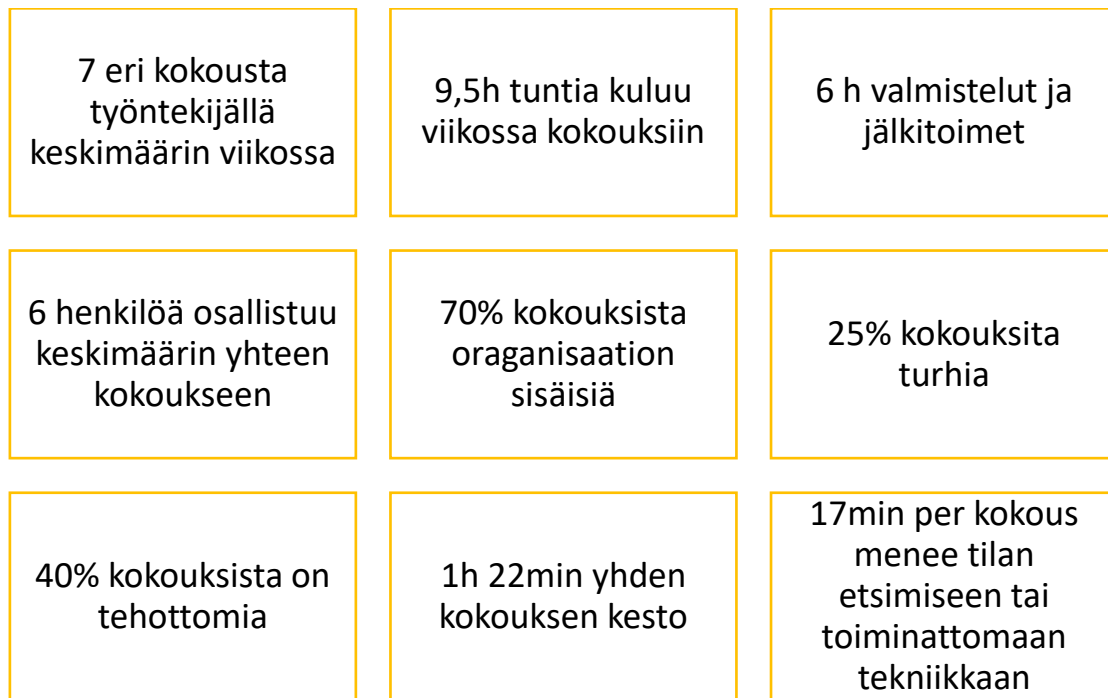
KUVIO 3. Kokoukset numeroina (mukaillen Kokousbarometri 2015.)

sisäisiä kokouksia. Kyselyyn vastaajien mukaan 25% kokouksista voitaisiin hoitaa muuten kuin kokouksittamalla. 40% prosenttia kokouksista ollaan todettu tehottomiksi. Yhden kokouksen keskimääräväiseksi ajaksi on määriteltä 1 tunti 22 minuuttia. Tutkimus kertoo, että 17minuuttia per kokous hukataan kokouksesta tilan etsimiseen tai toimimattomiin kokoustyökaluihin. (Kokousbarometri 2015.)