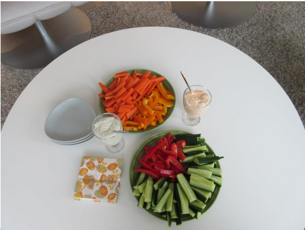
KUVA 2. Kokoustarjoilu