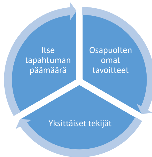
KUVIO 4. Tapahtuman tavoitteeseen vaikuttavat tekijät (mukailen Hollmen 2013.)

Kokouksen järjestäminen ja suunnittelu ovat vaativa ja monivaiheinen työ. Kokouksen järjestämiselle tulee laatia hyvä suunnitelma ja realistinen aikataulu. Kokouksen rahoitus on tärkeää olla selvillä heti lähtötilanteessa, jossa kokoussuunnittelussa voidaan keskittyä oleelliseen, eli mielenkiintoisen ohjelman ideoimiseen ja toteuttamiseen. Kokousta suunniteltaessa on tärkeää tietää kokouksen tavoite ja tarkoitus. Tavoitteet antavat pohjan kokouspaikan valinnalle, budjetille, aikataululle sekä markkinointisuunnitelmalle. Tavoitteen ja tarkoituksen pohjalta on helpompaa miettiä kokouksen ruoka ja juomatarjoiluja, kokouksen ympärillä olevaa sosiaalisia tapahtumia, oheisohjelmaa ja tarvittavia kuljetuksia ja majoituskia. (Rautiainen & Siiskonen 2013, 14, 54.)