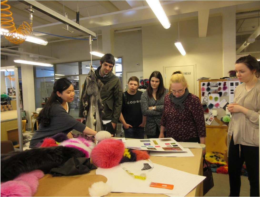
KUVA 7. Copsan hallitus tutustumassa turkisluokan Varax-projektiin