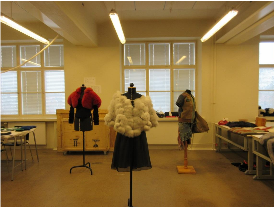
KUVA 8. Valmiit asukokonaisuudet