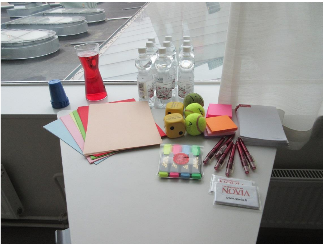
KUVA 4. Kokousvälineet