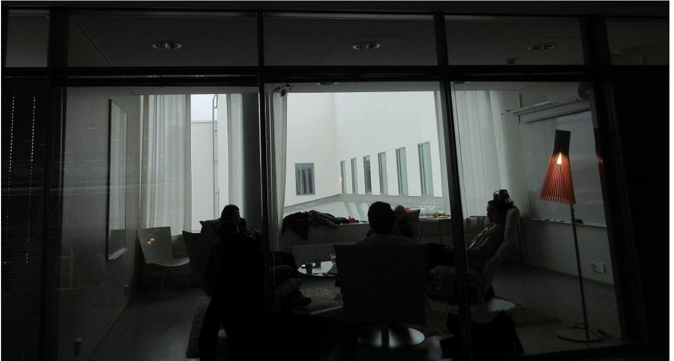
KUVA 6. Copsan hallitus pitämässä elämyksellistä kokousta

Hallituksen jäädessä kokoustamaan tarkistettiin, että kaikki olisi valmiina loppupäivän ohjelmaan. Hallitusta saavuttiin hakemaan 45 minuutin kuluttua, ja huomattiin, että kokoustilassa oli rento ja hauska ilmapiiri. Mietinkin, voitaisiinko mennä häiritsemään kesken heidän palaveria, sovitusta huolimatta. Kokous muutettiin epäviralliseksi liian vähäisen osallistujamäärän johdosta. Päivän aikataulua muutettiin joustavammaksi. Taukojen yhteydessä keskusteltiin tulevasta: millaisella aikataululla haluttiin päivää jatkaa, kuinka paljon haluttiin käyttää aikaa taukoon. Haluttaisiinko vielä jatkaa, vai keksittäisiinkö jotain muuta ohjelmaa päivän kulkuun. Hallituksesta kerrottiin, että tauon jälkeen haluttaisiin vielä hetken aikaa jatkaa kokousta.