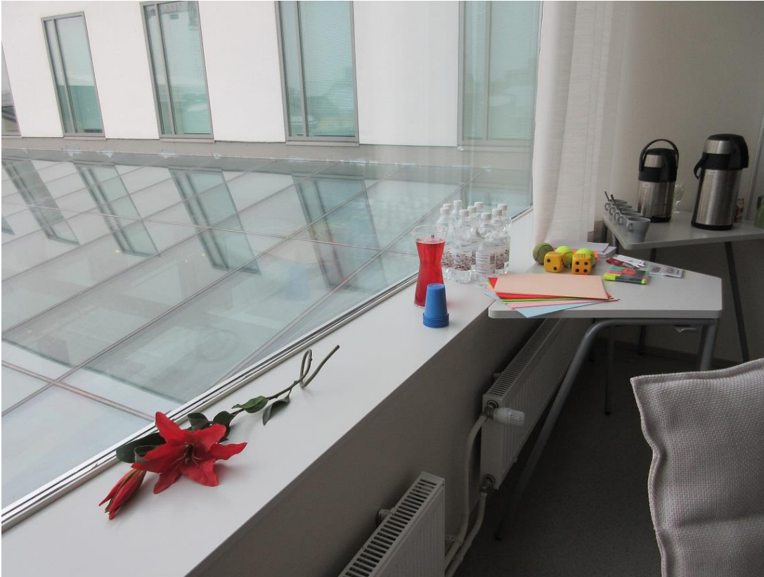
KUVA 5. Kokoussisustus