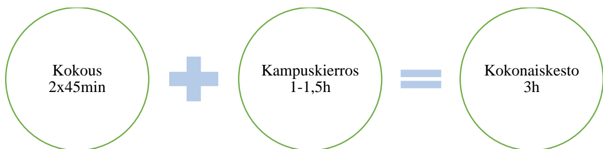
KUVIO 6. Pietarsaaren kampusvierailun kesto ja ohjelma

Unohtumattoman elämyksen viimeisessä vaiheena toimivat muistoesineet. Elämykset ovat usein näkyvämpiä ja koettavia, muistoesineet tekevät elämyksestä käsin kosketeltavan. Muistoesineet välittävät tietoa myös muille, ne toimivat hyvinä mainonnan välineinä. (Markkanen 2008, 43.) Muistoesineeksi muodostettiin kampus Allegro kassi, johon kerättiin kampuksen eri yritysten tuotteita. Kassilla haluttiin muistuttaa, miten monipuolinen kampus Pietarsaaresta löytyykään. Osallistujia haluttiin kiittää kirjeen muodossa (LIITE 1), jossa kerrottiin mitä kassista löytyykään. Teeman pohjalta lähdettiin keskustelemaan kokouksen ajankohdasta. Oltiin selvitetty, että paras viikonpäivä vierailulle olisi torstai, jolloin löydettäisiin nuorisopuolen- ja aikuispuolen opiskelijoita. Hallitukselle ehdotettiin kahta eri torstaita 24.3.2016 ja 31.3.2016, joista valittiin vierailuajan kohdaksi 31.3.2016. Ajankohdaksi myöhemmin tarkennettiin torstaiamupäivä. Vierailun ohjelma haluttiin jakaa kahteen osaan (KUVIO 6), kokoukseen ja kampus kierrokset. Elämyksellisen kokoustapahtuman Pietarsaaren vierailun kokonaiskestoksi muodostui 3 tuntia.