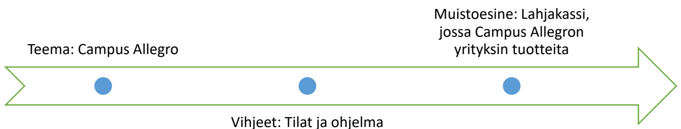
KUVIO 5. Unohtumattoman elämyksen rakennusvaiheet (mukaiillen Markkanen 2008, 43)

Kun elämyksellistä kokoustapahtumaa lähdettiin suunnittelemaan, käytettiin suunnitteluprosessissa Pine & Gilmore (1998) luomaa unohtumattoman elämyksen rakennusvaiheen mallia (KUVIO 5). Unohtumattoman elämyksen rakennusvaiheet muodostuvat kolmesta eri osasta: tapahtuman teemasta, vihjeistä sekä muistoesineestä. (Markkanen 2008, 43.) Ammattikorkeakoulun opiskelijakunnan toiminnanjohtajan Kupiaisen kanssa aloitettiin suunnittelemaan elämyksellistä kokoustapahtumaa helmikuun alussa. Tapaamisella toivottiin, että kokous tultaisiin järjestämään Pietarsaaren kampuksella. Kokouksen yhteydessä haluttiin, että päästäisiin tutustumaan Pietarsaaren kampukseseen ja opiskelijoihin. Toivottiin, että mukana olisi myös toiminnallista ohjelmaa. Elämyksellisen kokoustapahtuman teemaksi muodostettiin Campus Allegro. Centrian Pietarsaaren kampus sijaitsee Campus Allegrolla, josta löytyy myös muita ammattikorkeakouluja ja yritystoimintaa.