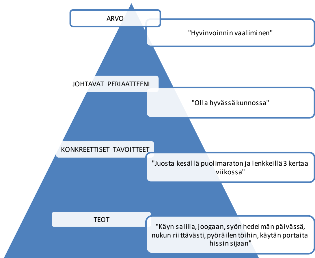
Kuva 1. Arvot, periaatteet, tavoitteet ja teot pyramidissa. (Pietikäinen 2016, 41)

Arvojensa tiedostaminen on tärkeää, koska ne liittyvät läheisesti tavoitteisiin ja määrittävät niitä toimintaperiaatteita, joiden avulla tavoitteet toteutetaan. Pietikäisen mukaan arvot voivat olla kuin kompassin osoittama ilmansuunta, jotka ohjaavat päivittäisiä valintoja. Arvoja voi selkiyttää tarkastelemalla arvoja ja niitä toteutavia tekoja hierarkkisen pyramidimallin avulla. Teot ovat askeleita kohti tavoitetta. (Kuva 1.)