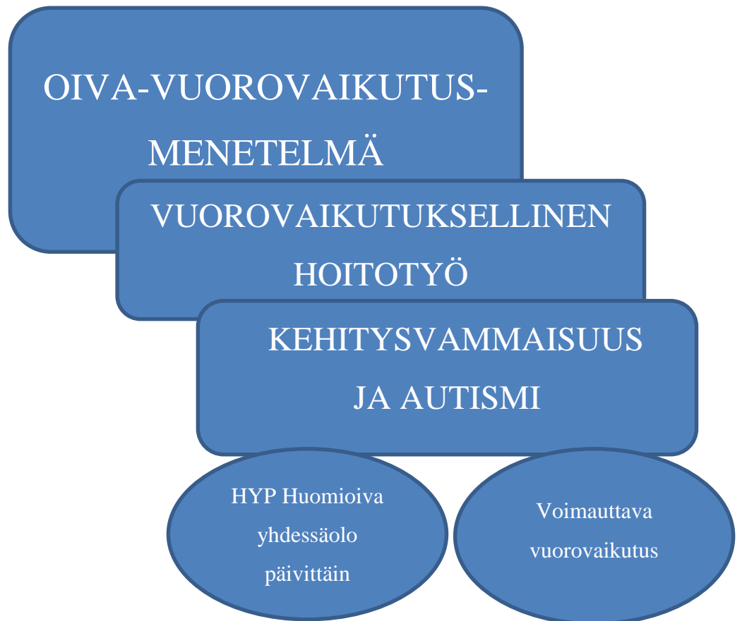
KUVIO 1. Teoreettinen viitekehys

Opinnäytetyön keskeiset käsitteet (kuvio1) ovat OIVA-vuorovaikutusmenetelmä, vuorovaikutuksellinen hoitotyö, kehitysvammaisuus ja autismi, HYP huomioiva yhdessäolo päivittäin ja voimauttava vuorovaikutus. HYP-menetelmää ja voimauttavaa vuorovaikutusta käytetään OIVA-vuorovaikutusmenetelmän rinnalla vuorovaikutustilanteissa. Käsitteet muodostuivat kirjallisuuden ja työelämäntapaamisen perusteella. Kirjallisuushaku tehtiin käyttämällä hakusanoja; autismi, vuorovaikutus, kehitysvammaisuus, OIVA-vuorovaikutusmenetelmä, HYP, voimauttava vuorovaikutus, intensive interaction ja autism. Käytämme hakukoneita olivat muun muassa Google Scholar, PubMed, ARTO ja Duodecim.