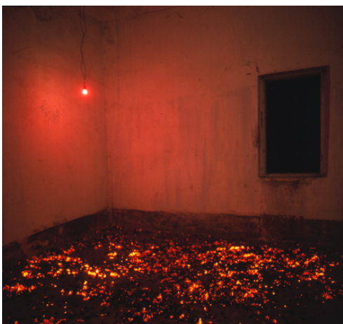
Kuva: Bernard Faucon

Valokuvista lähti monta ideaa toteutukseen asti. Ohjaajan löytämistä Bernard