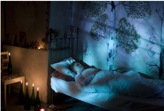
Sara Saxholmin näyttelemä tyttö ei saa unta

Illan päätteeksi teimme vielä mini unitilla autokohtauksen ilta-ajot. Päivä venyi hyvin pitkäksi ja näyttelijä oli jo erittäin väsynyt. Teimme samalla metodilla, millä olimme päivällä kuvanneet. En tosin nähnyt luupista juuri mitään ja jouduin