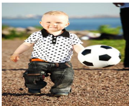
Figur 1. Fotbollskille.

Idrottsföreningar har genom historien haft en stor betydelse för orternas lokala identiteter i vårt land, det har inte enbart handlat bara om själva idrotten utan idrottsföreningarna har t.o.m. haft en stor politisk betydelse. Politiska aspekten har nuförtiden minskat men betydelsen för den lokala identiteten är fortfarande ganska stor, speciellt på mindre orter. Idrotten är fortfarande den överlägset populäraste hobbyformen, speciellt bland barn och unga. Nästan varannan finländare i åldern 3 - 18 år deltar i någon sorts idrottsföreningsverksamhet. Bland vuxna i åldern 19 - 69 år deltar ungefär 15 % i idrottsföreningsverksamhet. Mängden har fördubblats från 1970-talet och största orsaken till detta är att man nuförtiden går med i idrottsföreningsverksamheten allt tidigare. Den gamla kulturen med att spela på gården och leka med grannarna har försvunnit nästan helt och hållet, medan det ordnas organiserad idrottsverksamhet redan åt små barn. Det är inte alls ovanligt i dagens läge att 3 åringar är med i idrottsföreningsverksamheten. Man har också under de senaste årtionden satsat mycket på senior och veteranidrott. Det är nuförtiden mycket populärt att träna och tävla ännu i 40 - 60 års åldern och vara med i en idrottsförening.