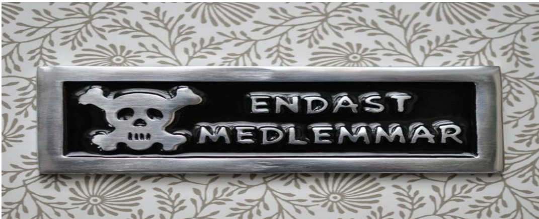
Figur 2. Medlemmar.

Styrelsen skall uppehålla en förteckning över föreningens alla medlemmar. Förteckningen skall innehålla information om medlemmarnas namn och hemort. Denna information har föreningen rätt att kräva av sina medlemmar, annan information som t.ex. medlemmars e-postadresser och telefonnummer är inte obligatoriska i medlemsförteckningen och där tillämpas personregisterlagen.