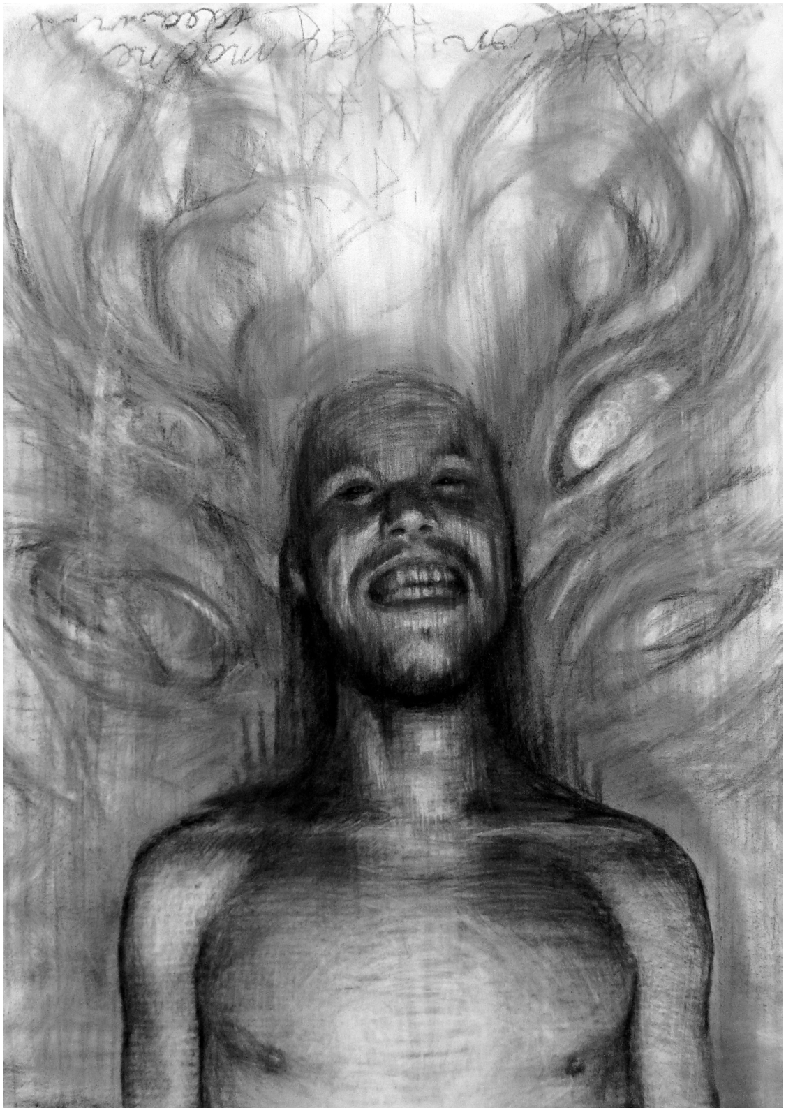
Kuva 5. Kolmas vaihe. Taustan hahmotus ja yhdenmukaistaminen.