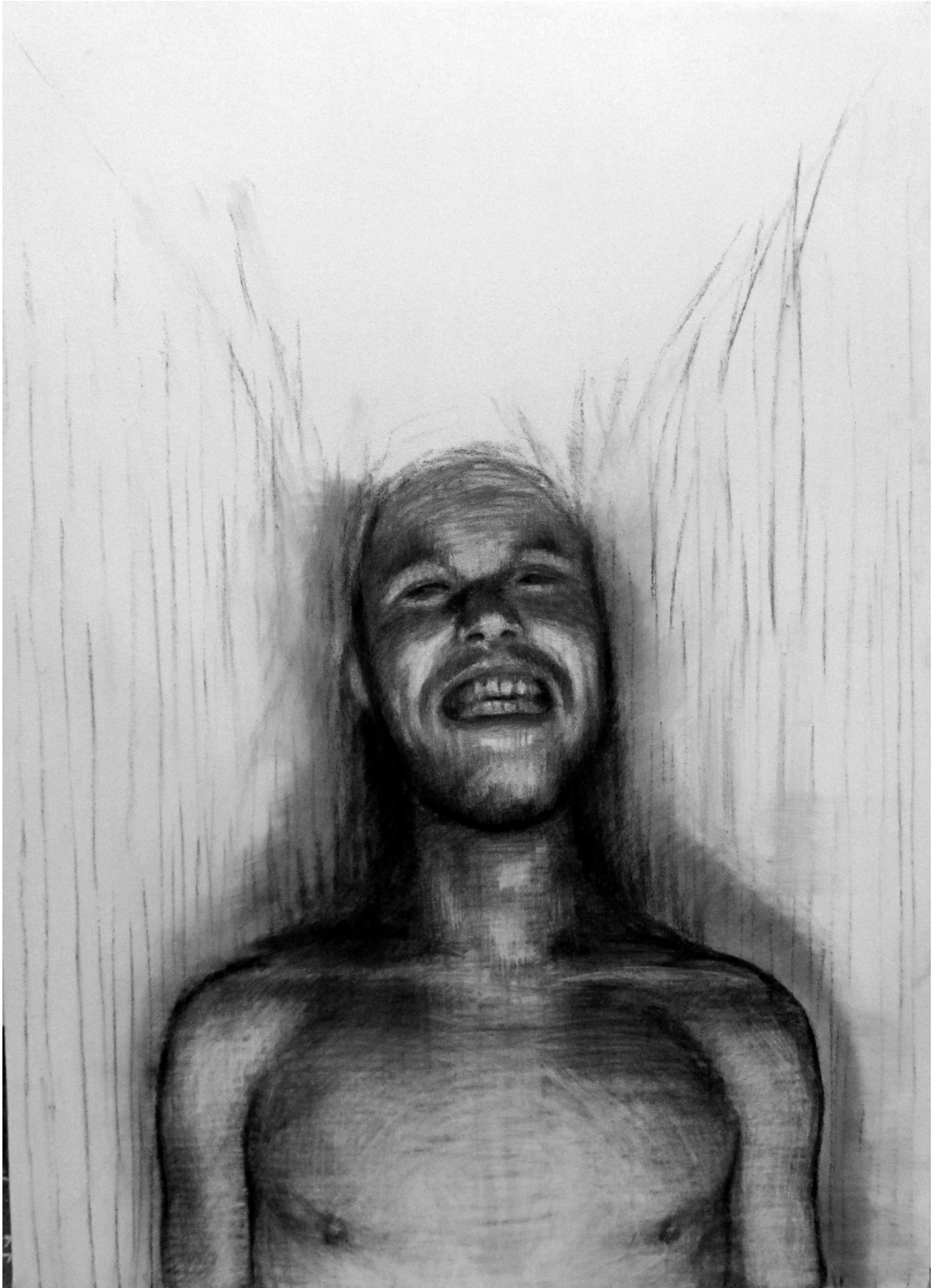
Kuva 4. Toinen vaihe. Valon ja muodon hahmottaminen.