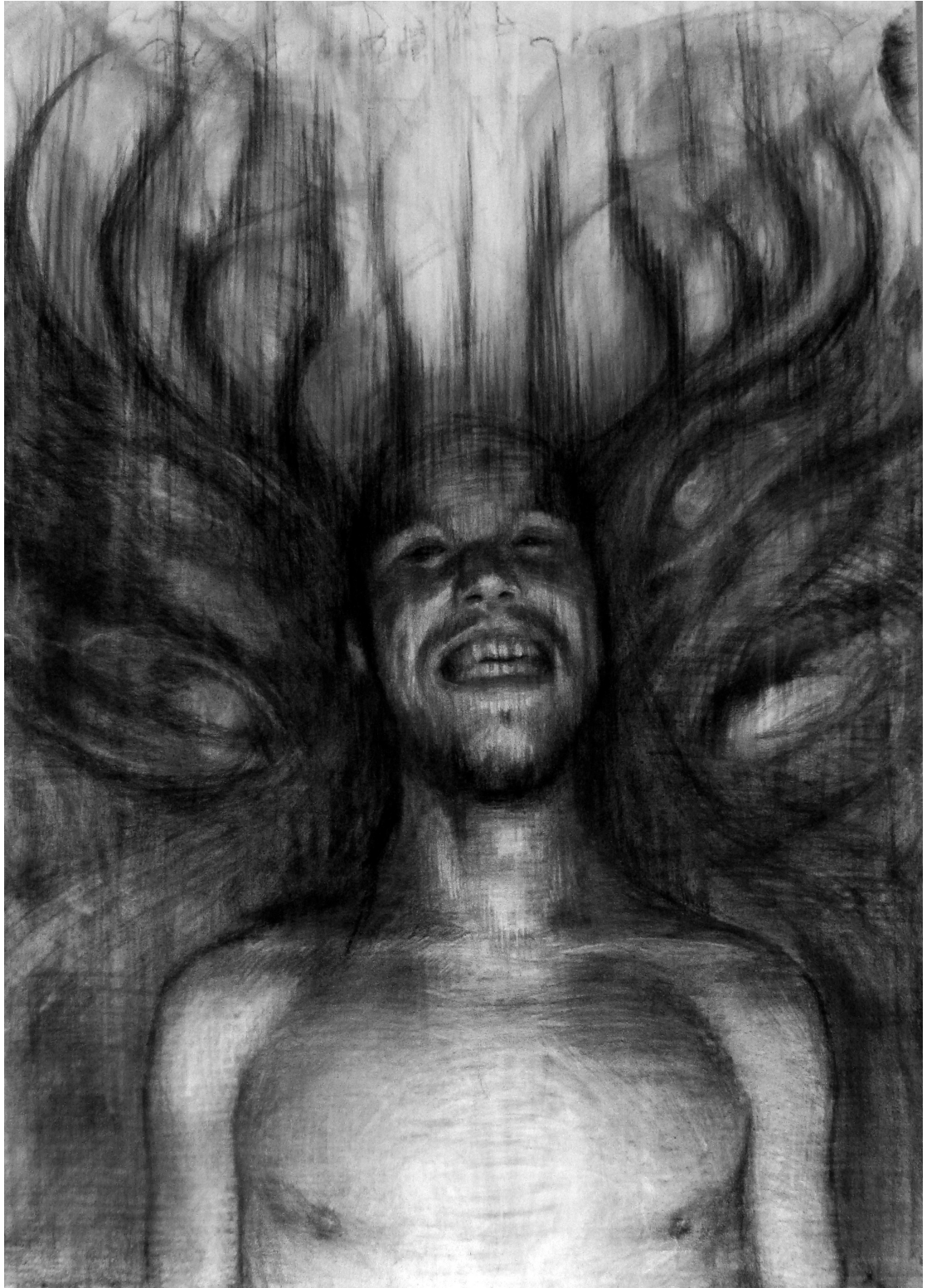
Kuva 6. Viimeinen vaihe ennen öljyväriä. Päähuomiassa tummuusasteet.