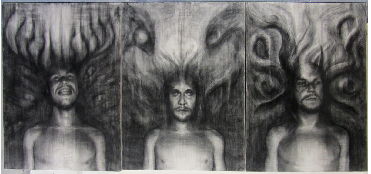
Kuva 7. Kokonaisuus hiilellä. Kuvasta ilmenee taustan sulautuminen toisiinsa.