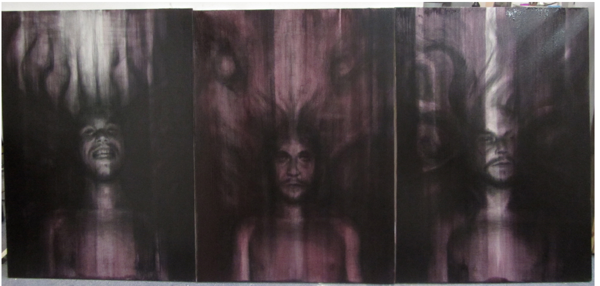
Kuva 8. Kokonaisuus öljyvärin jälkeen. Sekoitin maaliin runsaasti pellavaöljyä, joka lisäsi liukuvuutta ja vähensi väripigmentin vahvuutta suhteessa öljyn määrään.

Viimeinen työvaiheeni oli käyttää öljyväriä saadakseni purppuraisen värin sekä vaikutelman huuhtoutuneesta maalauksesta. Purppura värinä valikoitui lievästä värisokeudestani johtuen, jonka takia vain punaisen ja sinisen välinen skaala on ehyt. Olen mieltynyt purppuraan värinä muutenkin, sillä sitä esiintyy vähän luonnossa ja siitä välittyy intensiivinen tunne. Pidän tätä väriä mystiikan ja syvemmän tiedon välikappaleena. Teoksessani tämä syvempi tieto on valumassa