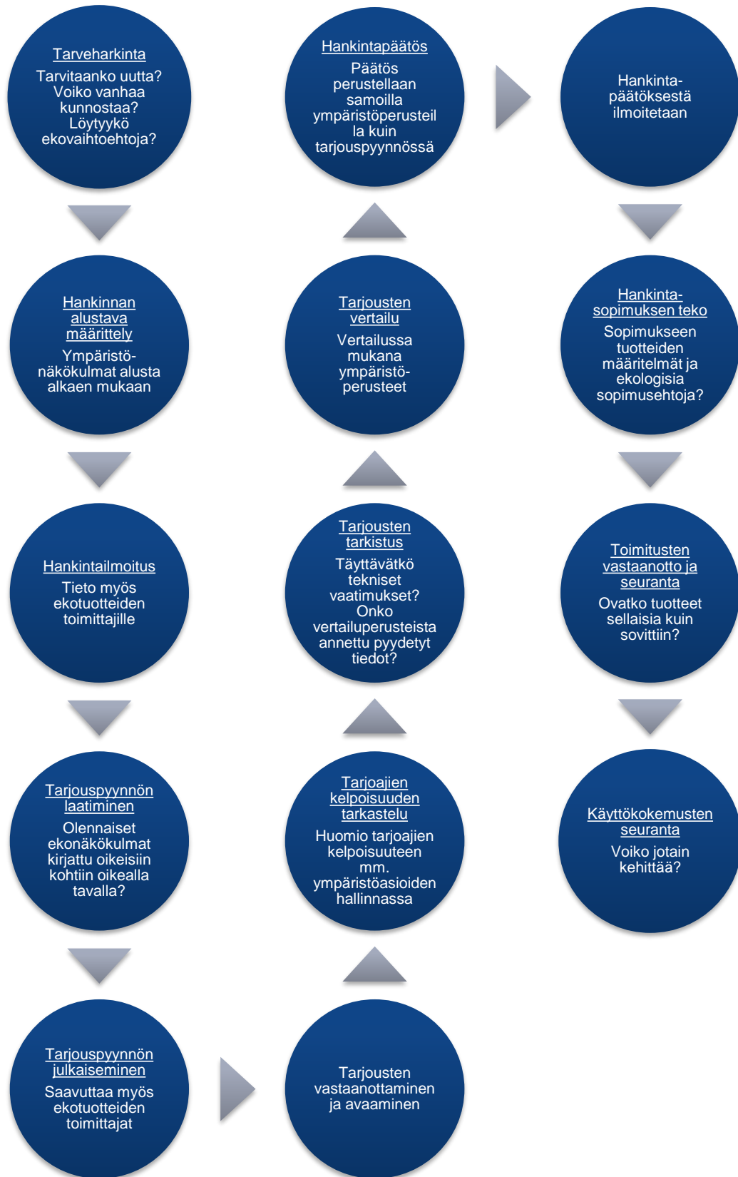
Kuvio 3. Ympäristönäkökohtia hankintaprosessin eri vaiheissa. (Muokattu; Nissinen 2004, 32).