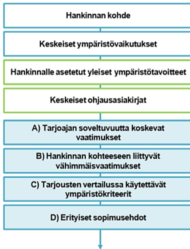
Kuva 3. Tuoteryhmien ohjeistuksen rakenne. (HUS 2012, 63).

Viidellä ensimmäisellä pääryhmällä on yhteensä 31 erilaista alakohtaa. Kunkin alakohdan eli tuoteryhmän kohdalla kerrotaan tarjoajan soveltuvuusvaatimukset, hankinnan kohteen ehdottomat vaatimukset, tarjousten vertailun ympäristökriteerit ja erityiset sopimusehdot. Tuoteryhmiä ovat esimerkiksi lääkintälaitteet, sairaalalakalusteet, puhdistus tuotteet ja muoviset hoitotarvikkeet. (HUS 2012.)