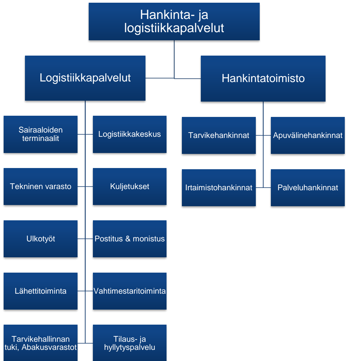
Kuvio 1. Hankinta- ja logistiikkapalveluiden tehtävien jakaantuminen.

Opinnäytetyö rajoittuu kuvion oikean puolen, eli hankintatoimiston toimintatapoihin, sillä logistiikkapalveluiden moninaiset työtehtävät eivät liity tiiviisti varsinaiseen hankintatoimeen.