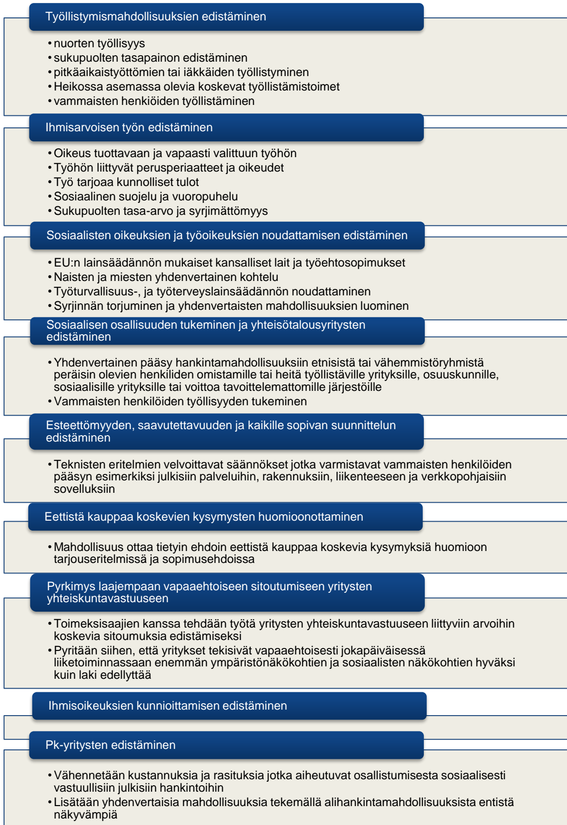
Kuvio 4. Esimerkkejä sosiaalisista näkökohdista. (Muokattu; Euroopan komissio 2011, 7-9).