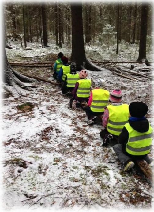
Kuvio 1 Eskareiden retki lähimetsään