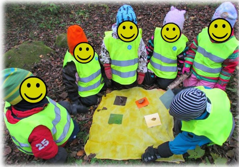
Kuvio 3 Lapset ihmettelemässä luonnon värejä

Kolmas retki järjestettiin 27.10.2016, jossa lapsia oli mukana yhdeksän, kaikki 5-vuotiaita. Retki tehtiin läheiselle rannalle. Alla työntekijän kirjattuja muistiinpanoja retken kulusta.