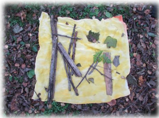
Kuvio 2 Luonnon aarteita

- Retkellä keppien ja aarteiden keräily oli lapsista kivaa, sekä kiipeily. Osa teki löytyjä ja havaintoja. ”Löysin sienen!”, ”Kato, tuolla on etana!”, ”Ne heiluu” (tuuli liikuttaa puun lehtiä), ”Tuosta on kaadettu puu!”