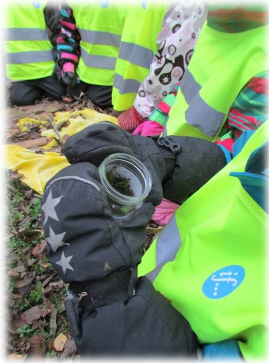
Kuvio 4 Sammaleen tutkimista