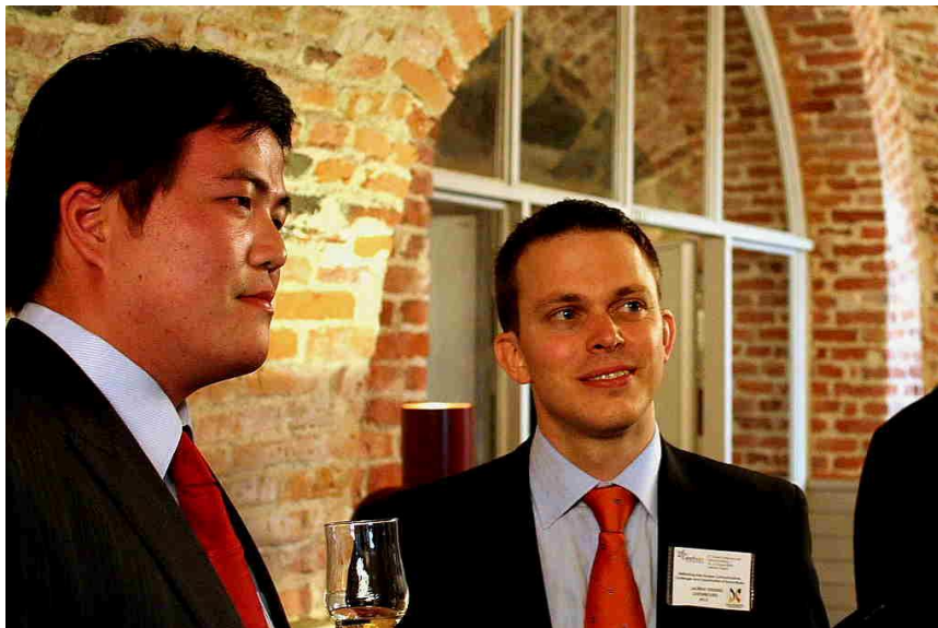
Figur 4. Deltagare på konferensens öppningsmottagning, fotograf: Heikki Wilenius

Evenemangets genomförande, processens tredje fas efter planering och implementering, pågick under fem dagar från onsdagen den 19 augusti till söndagen den 23 augusti 2009. Arrangörerna fick under genomförandet hjälp av tre personer till som inte hade kunnat delta aktivt i planeringsprocessen. Ett speciellt drag under denna konferens är att alla arrangörer även var anmälda som deltagare i AGM. Det innebär att vi som planerat inte kunde arbeta med arrangemangen i bakgrunden under genomförandefasen. Vi arbetade i stället hela tiden som synliga värdar. Förutom det var flera av arrangörerna tvungna att vara på sina egna jobb vid något tillfälle under de fem dagarna. Detta innebär fem mycket intensiva dagar och kort nattsömn för oss som arrangerade. I detta kapitel beskrivs genomförandet av evenemanget. För de tre första konferensdagarna presenteras arrangörernas interna tidtabell. Orsaken till att den finns presenterad för just dessa dagar är att arrangörerna då hade en aktiv roll då det gällde att hålla i trådarna för att allt skulle löpa och inga programpunkter skulle utebli. Under Post-AGM kunde man följa det gemensamma programmet och improvisera utgående från vädret.