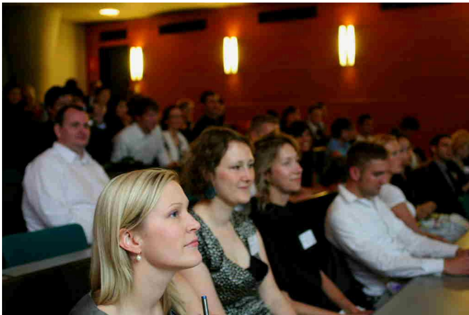
Figur 5. Konferensdeltagare vid konferensens inledande inforamtionstillfälle, fotograf: Heikki Wilenius

“This was one of the best organized conferences I have ever attended. The quality of the programme was truly remarkable. Thank you and well done.”