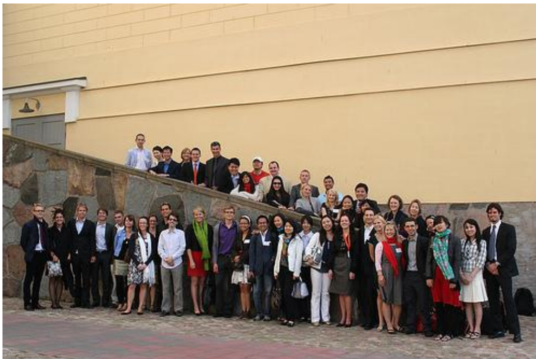
Figur 1. Deltagarna i ASEFUAN 8th Annual Conference and General Meeting i Helsingfors 2009. Bild tagen utanför Finlands utrikesministerium, fotograf: Heikki Wilenius.