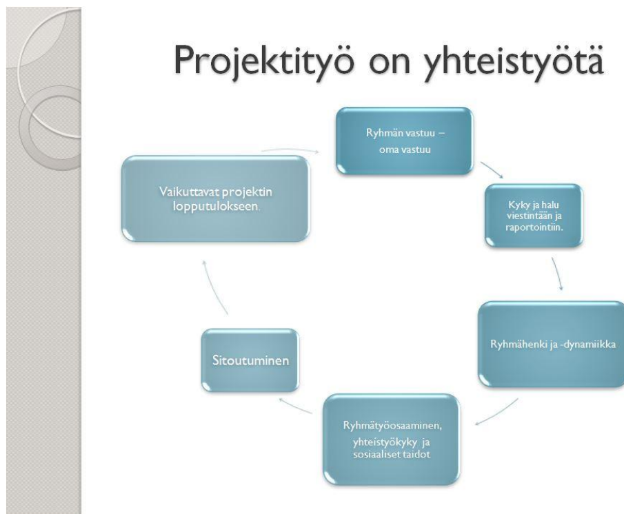
Kuva 10. Kuvaus projektityön ohjaamisen haasteista. (Seminaariesitys M. Arohonka)

teisesti tähdätään. Näin kustannuksetkin pysyvät oikeissa mittasuhteissa. Projektin osa-alueiden toteutuksessa auttaa myös neuvottelutaito kustannusten jakamisesta yhteistyökumppaneiden kanssa.