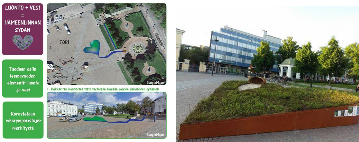
Kuva 4. Ote H. Nukin suunnitelmaluonnoksesta.