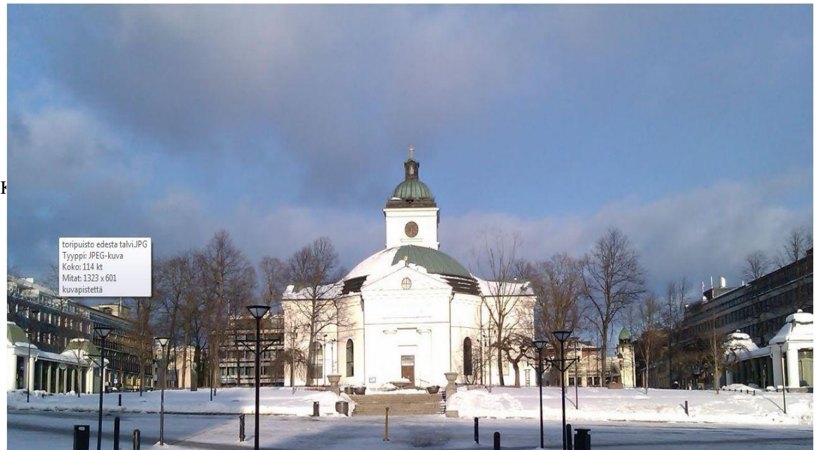
Kuva 2. Valittu projektien toteutusalue: Hämeenlinnan torialue ja Toripuisto talvella 2016 suunnitteluvaiheen alussa.