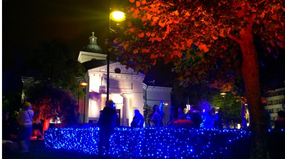
Kuva 11. Kohtaamisten puiston tunnelmaa (M. Arohonka)

Projektit ovat parhaimmillaan oppilaitoksen kunnia-asia, tärkeänä näyttönä oman ammattikunnan edustajille ja yrityksille oppilaitoksen opiskelijaosaamisesta ja heittäytymisestä uuden luomisessa.