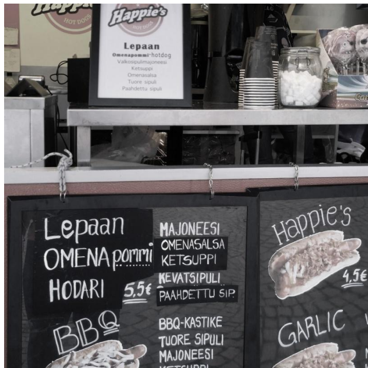
Kuva 9. Yhteistyökumppaneiden kanssa tehdyt neuvottelut tekivät tapahtumasta yksilöllisen. Kohtaamisten puisto-tapahtumassa myytiin Lepaan nimikko hotdogia: Lepaan Omena Pommia.