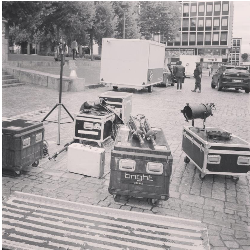
Kuva 8. Kohtamisten puisto rakentuu, ääni – ja valotekniikan asennusta.