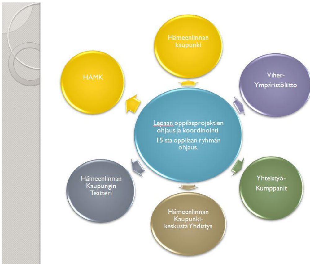
Kuva 3. Kuvaus ryhmänohjauksen työskentelyalueen verkostosta. (Seminaariesitys M. Arohonka)

Normaali opiskelukäytännön mukaisesti seuraava askel oli opiskelijoiden ilmoittautuminen Moodle-alustalle ja viestinnän aloittaminen. Viestintäkanavana ryhmät käyttivät myös itse perustamia Facebook -ryhmiä keskenään. Projektin aikana tiedostojen jakaminen tapahtui OneDrivivessa ja palaverit käytiin Skype välityksellä. Ryhmätapaamisia Lepaalla järjestettiin mahdollisimman usein, lähiopiskeluaikojen puitteissa.