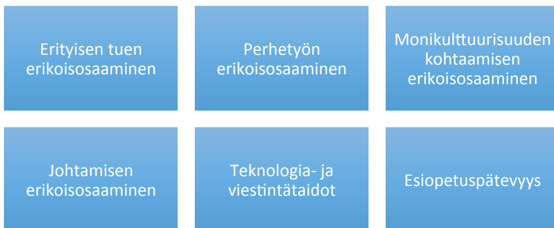
Kuvio 3. Tulevaisuudessa tarvittavat erikoisosaamistarpeet toisen kyselyaineiston mukaan