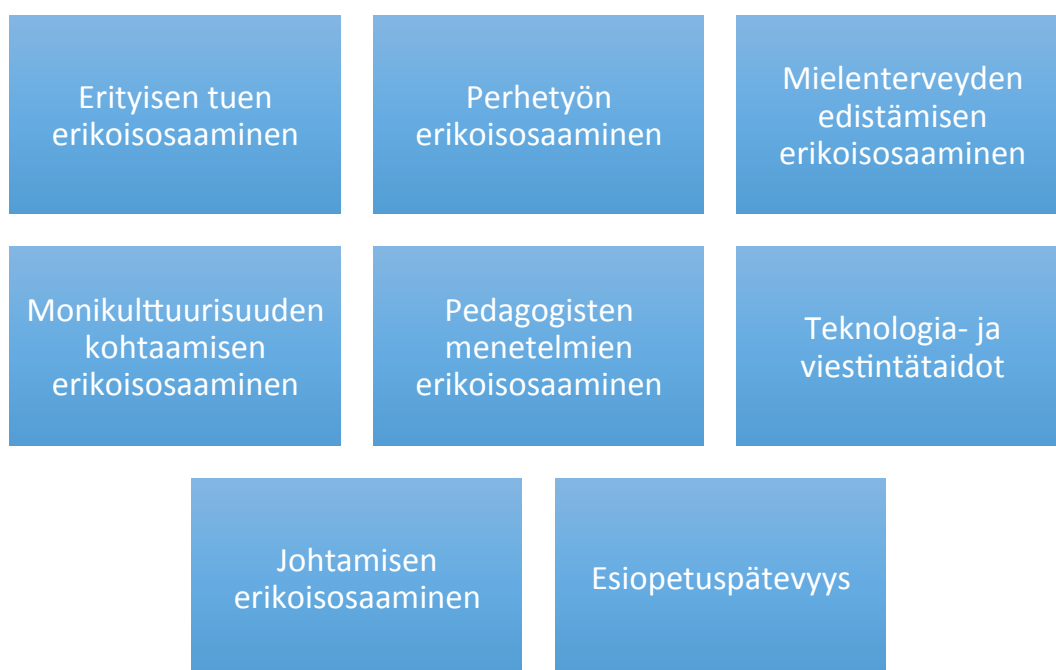
Kuvio 1. Tulevaisuudessa tarvittavat erikoisosaamisen tarpeet ensimmäisen kyselyaineiston mukaan

Ensimmäisessä, kesän 2015 kyselyaineistossa vastaajia pyydettiin pohtimaan, millaista erikoisosaamista he uskovat tarvitsevänsä työssään varhaiskasvatuksessa tulevaisuudessa. Vastausten pohjalta olen nostanut esiin erikoisosaamisen teemoja, jotka erityisesti korostuvat vastauksissa. Useassa vastauksessa nostetaan esiin monta teemaa. Olen eritellyt kyselyaineiston tulokset luokittelurungossa (liite 4, taulukko 1). Kesän 2015 kyselyn tuloksia kuvaavat luvut (5.1-5.8) on otsikoitu kyselyn vastauksissa käytettyjen ilmaisujen perusteella, joita hyödynnettiin myös luokitusrunon laatimisessa.