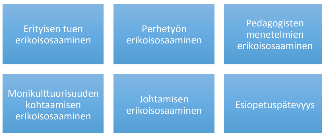
Kuvio 2. Nykyhetkellä tarvittavat erikoisosaamistarpeet toisen kyselyaineiston mukaan

Moni vastaaja mainitsi vastauksessaan monia erikoisosaamisen tarpeita kun kysyttiin sitä, mitä sosiaalialan erikoisosaamista vastaajat tarvitsevat nykyisessä tehtävässään varhaiskasvatuksen alalla (liite 4, taulukko 2.)