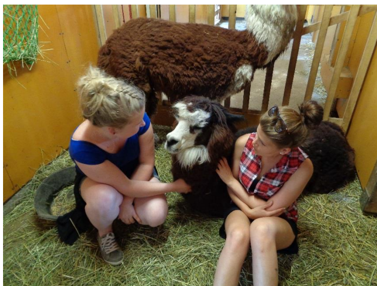
Kuvio 1: Eläintenohjaaja ja asiakas.