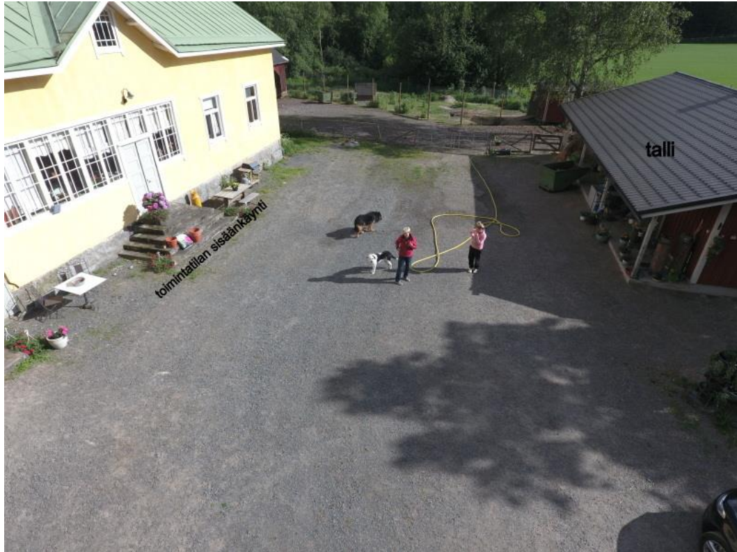
Kuvio 3: Toimintatilat. Pääsääntöisesti toimintaa järjestettiin tallissa ja pihapiirissä. Toimintatiloissa aloitettiin ja lopetettiin toimintakerrat.