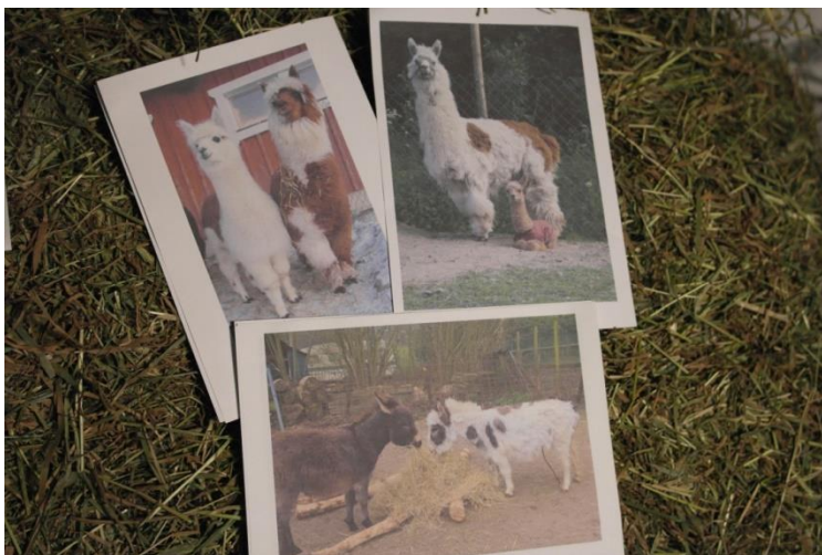
Kuvio 5: Toiminnassa käytettyjä kuvakortteja.

Kotona lapset olivat laittaneet kuvia esimerkiksi oman huoneen seinälle tai jääkaapin oveen. Kaikki eivät olleet löytäneet paikkaa saaduille kuville. Kuvien avulla lapset saattoivat kotona kertoa mihin toimintaan kuvat liittyvät tai asioita kuvan eläimestä. Tällä tavalla saatiin hie- man lisättyä huoltajien ja lapsen vuorovaikutusta sekä huoltajat näkivät mitä lapset olivat tehneet tilalla. Eräs huoltaja sanoi loppuhaastattelussa, että