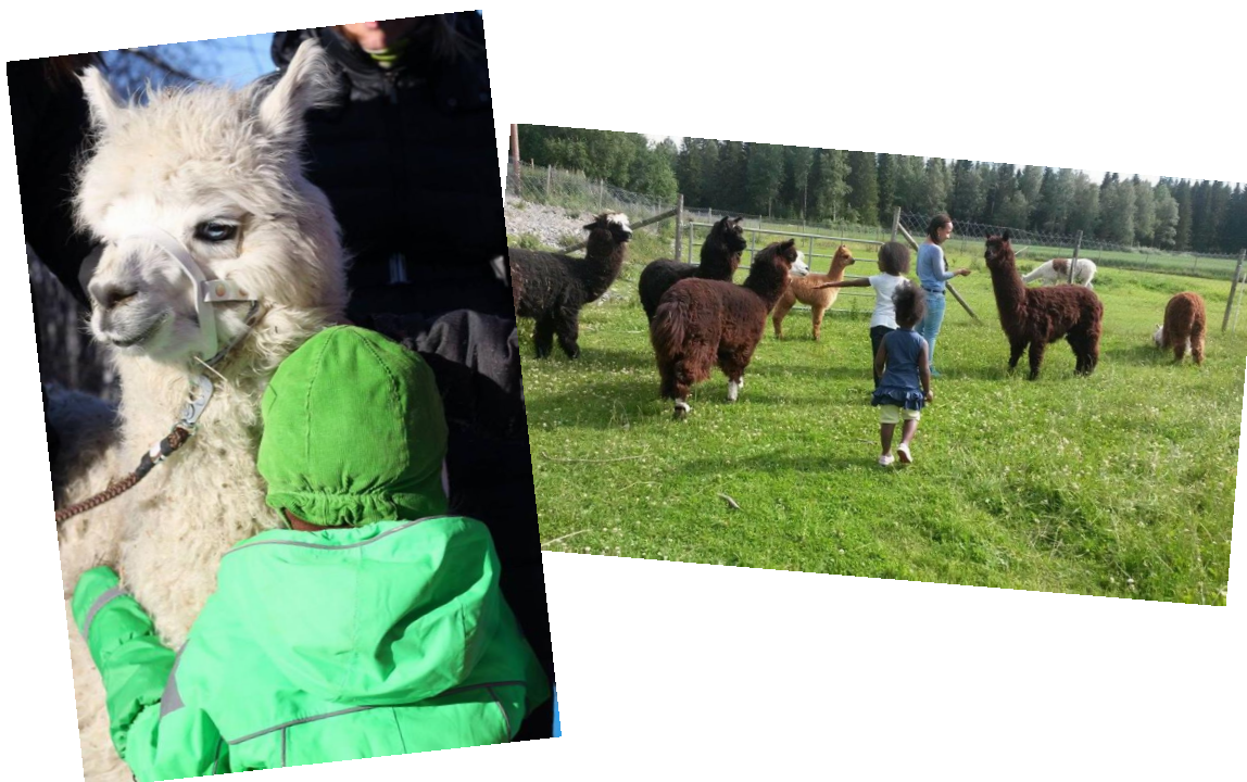
Kuvio 2: Eläimet ja lapset. Eläimet voivat antaa lapselle ehdotonta rakkautta, mutta eläinten kanssa toimiessa aikuisen on aina hyvä olla läsnä. (Kuvissa ei ole opinnäytetyöhön osallistuneita lapsia.)

Eläimen avustuksella siis voidaan kasvattaa lapsen itsetuntoa, tuoda onnistumisen kokemuksia, tukea oppimista, motivoida ja vähentää sosiaalisia paineita. Eläin myös helpottaa lapsen kanssa käytävää vuoropuhelua. Näiden lisäksi eläinten on todettu yleisesti vähentävän ahdistuneisuutta ja stressitasoa sekä kannustavan liikkumaan, lisäävän mielihyvän tunnetta ja opettavan tässä hetkessä olemista. (Soini 2014, 50-62.)