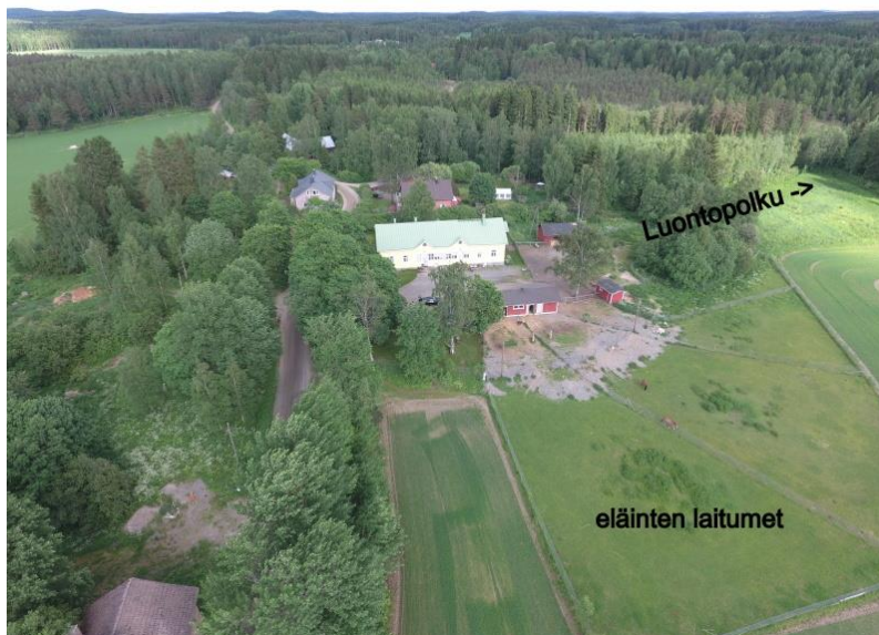
Kuvio 4: Eläinten laitumet ja luontopolku. Eläinten laitumilla havainnoitiin eläinten käyttäytymistä ja luontopolulla voitiin käydä kävelemässä turvallisessa ympäristössä eläinten ja lasten kanssa.

Ennen opinnäytetyötoiminnan aloitusta toiminnan rakenteelle oli siis valmis malli, jonka ympärille lähdettiin suunnittelemaan toiminnan sisältöä. Toiminnan sisällön suunnittelussa huomioitiin lasten ikäkehitys että vanhempien esittämät toiveet tavoitteille sekä lasten haasteet