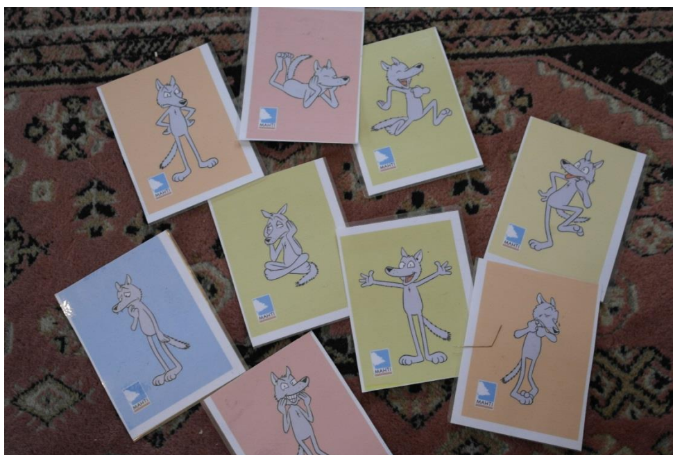
Kuvio 6: MAHTI tunnekortit.

toiminta tapahtui aina koulupäivän päätteeksi ja lapset tuntuivat tarvitsevan tilaa purkaa energiaansa. Ylivilkkaus myös koettiin johtuvan lasten yksilöllisistä haasteista, kuten siirtymiset tehtävästä toiseen ja erityisen huomion tarvitseminen aikuiselta. Muun muassa pelkotilat purkaantuivat ylivilkkautena ja niissä tilanteissa lapsi tarvitsi erityisesti aikuisen tukea. Esimerkiksi lapsi saattoi pelätä hevosen kanssa tehtäviä asioita niin, että lähti juoksemaan pois paikalta tai uhmasi ohjeita. Eräällä lapsella tämä toistui aina, kun ehdotettiin hevosen kanssa toimintaa. Hän lähti tilanteesta pois ja juoksi ympäri tallin pihaa. Tahattomalla toiminnallaan ylivilkkaus saattoi tarttua myös muihin lapsiin. Tilanne saatiin aina rauhoitettua puhumalla ja ehdottamalla muuta toimintaa hevostoiminnan sijalle. Ylivilkkaus ei siis välttämättä ole osa lapsen luonteenpiirrettä vaan se saattaa olla oire, jonka aiheuttaa muut tekijät kuten pelkotilat tai turvattomuuden tunne.