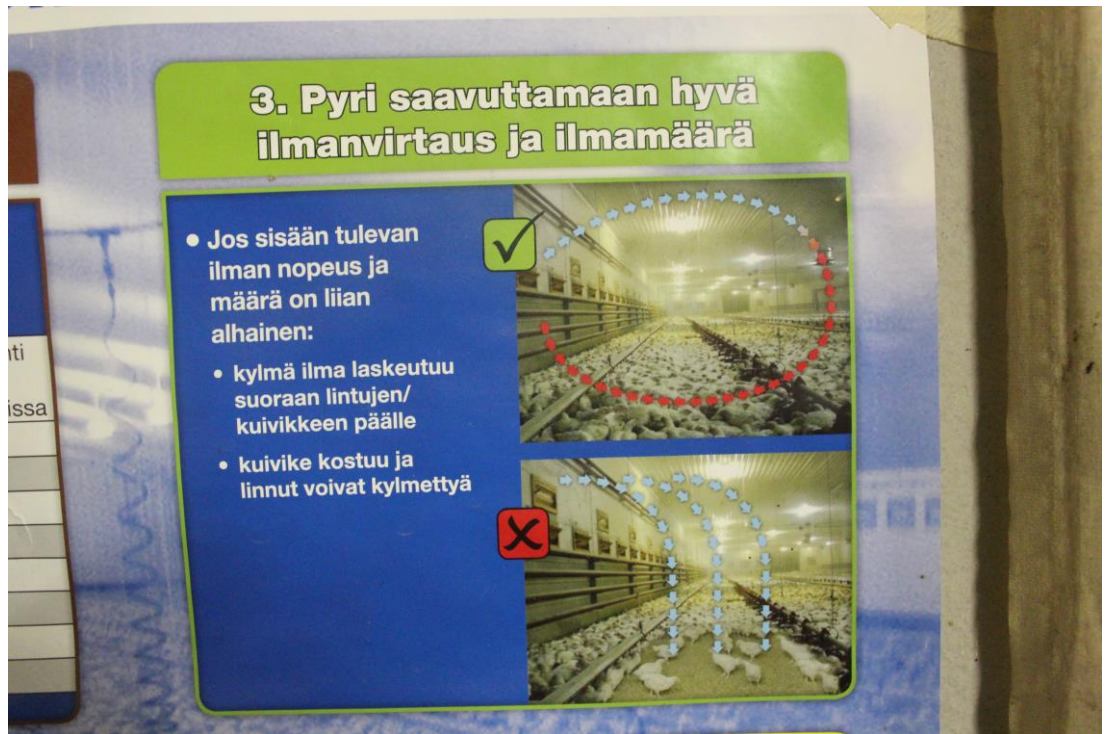
Kuva 2. Kuva kasvattamon seinältä, miten ilman tulisi kiertää (Kivistö, 2016).

Hallin sisällä on automaattinen ilmanvaihto, jonka avulla sisäilma pidetään raikkaana (kuva 2). Ilmanvaihto tapahtuu katossa olevien imureiden avulla. Lisä ilmanvaihtoa varten helteille on päädyssä oltava ns. jättipuhallin. Jättipuhallin on neliön mallinen 1,5 metriä reunasta reunaan oleva iso puhallin. Puhaltimen tehtävä on imeä helteillä kasvattamosta ilmaa ja näin saada ilma kiertämään hallissa tehokkaammin.