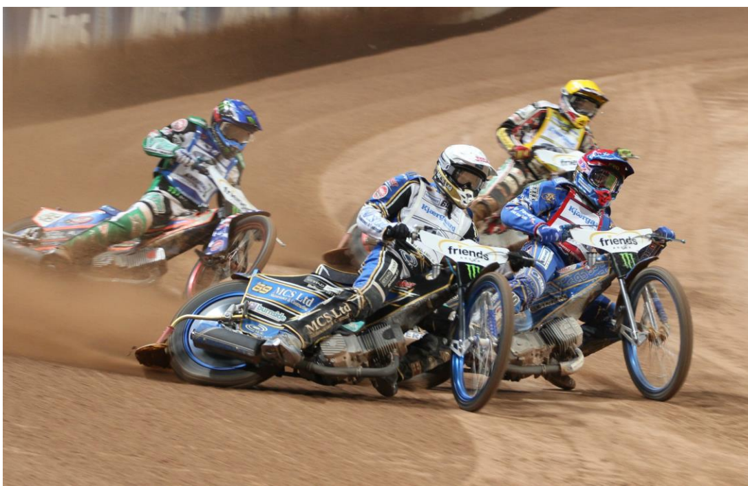
Kuva 1. Speedwaytä ajetaan ovaalinmuotoisella sorapintaisella radalla. Yhdessä erässä radalla on aina neljä kuljettajaa.

Henkilökohtainen maailmanmestaruus ratkaistaan Speedwayn Grand Prix-sarjassa, jossa vuonna 2017 kilpaillaan 12 osakilpailussa. Speedway World Cup eli joukkue-MM ratkotaan myös vuosittain viikon kestäväksi turnaukseksi heinäkuun aikana. Eri maissa ajetaan maiden mestaruussarjoja, joissa 2-5 joukkuetta ottelee kohden taistelee keskenään voitosta. Suurimmat tällaiset liigat ajetaan Englannissa, Puolassa ja Ruotsissa. Myös Suomessa ajetaan joukkueiden Suomenmestaruudesta ja ensimmäiset kansalliset mestaruudet onkin jaettu jo 1950-luvun alkupuolella. (Porin Moottorikerhon verkkosivut 2017.)