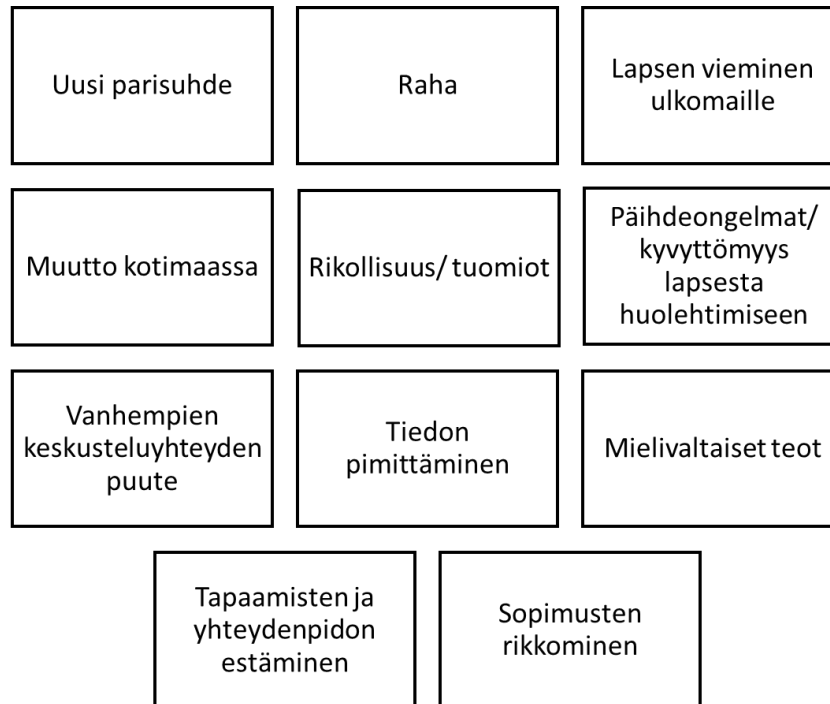
Kuvio 1 Käytetyt värikoodit

formaatiota aineisto sisältää. Aineiston jäsentämistä varten avuksi tarvittiin koodeja. Tutkimuksessa päädyttiin käyttämään värikoodeja, joista jokaiselle annettiin oma merkityksensä. Värikoodeja oli yhteensä 11, ja niitä apuna käyttäen aineistosta etsittiin tiettyjä piirteitä ja toistuvuuksia. Koodaamisprosessissa aineistoa käytiin läpi useita kertoja, jotta aineiston sisältämä oleellinen informaatio saatiin poimittua tekstin joukosta. Kuvio 1 esittää aineiston jäsentelyssä käytetyt 11 värikoodia.