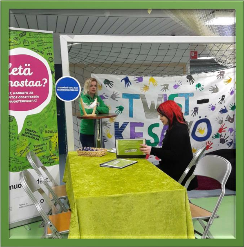
Vuonna 2017 Iisalmen nuorisopalvelut Megatärskyt 2017 tapahtumassa.

sekä sosiaalisen median kanavien hyödyntäminen. Markkinoinnissa on monet keinot sallittuja sekä mielikuvitus rajana, kunhan saada tavoitettua ne nuoret ja heidän huoltajat, jotka Twist-kesätyöhön voi hakea!