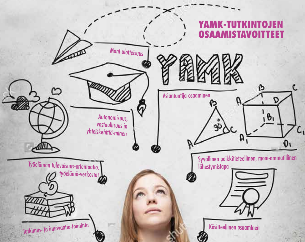
Kuvia 1. YAMK-tutkintojen osaamistavoitteet (European Qualifications Framework (EQF); QAA Scotland, 2013; Opiskelija- ja alumnikyselyt, kevät 2015 ja 2016).

Ylemmissä ammattikorkeakoulututkinnoissa (YAMK) lähtökohta on aito työelämä, sen tutkimuksellinen kehittäminen ja tiedon yhteisluominen. Tutkinnot ottavat kiinni työelämän kehittämishaasteisiin ja tuovat työelämän muutoksiin uutta asiantuntijaosaamista.