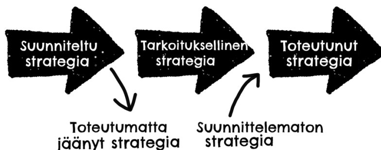
Kuvio 1. Suunniteltu ja suunnittelematon strategia (mukaillen Ahlstrand, Lampel ja Mintzberg 2009, 12.)

Mustonen (2009) korostaa henkilöstön roolia strategian toteutumisessa. Hänen mukaansa henkilöstö on strategian toteuttamisessa avainasemassa, koska henkilöstön jäsenet vievät strategiaa käytäntöön jokapäiväisessä työssään. Tämä edellyttää, että henkilöstön on tunnettava ja ymmärrettävä strategian sisältö sekä sitouduttava toteuttamaan sitä. Tämä ei onnistu ilman viestintää. Strategiasta tietoa antava viestintä ja sen onnistuminen ovat merkittävässä asemassa yrityksen menestyksen kannalta. Tämä ilmenee esimerkiksi Beerin ja Eisenstatin (2000, 29-40.) tekemässä tutkimuksessa, jonka mukaan kymmenen kahdestatoista yrityksestä nimesi huonon vertikaalisen viestinnän yhdeksi suurimmaksi strategian toteutumista estäväksi tekijäksi. Myös Dobni (2003, 43-46.) tukee tätä väitettä todetessaan, että huonosta ja tehottomasta viestinnästä aiheutuva luottamuspula vaikeuttaa strategian toteutumista. Hänen mielestään yritysjohton tärkein tehtävä on tunnistaa ja poistaa hyvän kommunikaation esteet organisaatiosta. Monet yritykset epäonnistuvat tavoitteidensa saavuttamisessa siksi, että huonon viestinnän myötä tavoitteet ymmärretään henkilöstön tasolla väärin. Ne henkilöt, joilla ei ole ymmärrystä strategisista asioista, ovat strategian toteutumisen suurin este. (Mustonen 2009, 1-2, 8.)